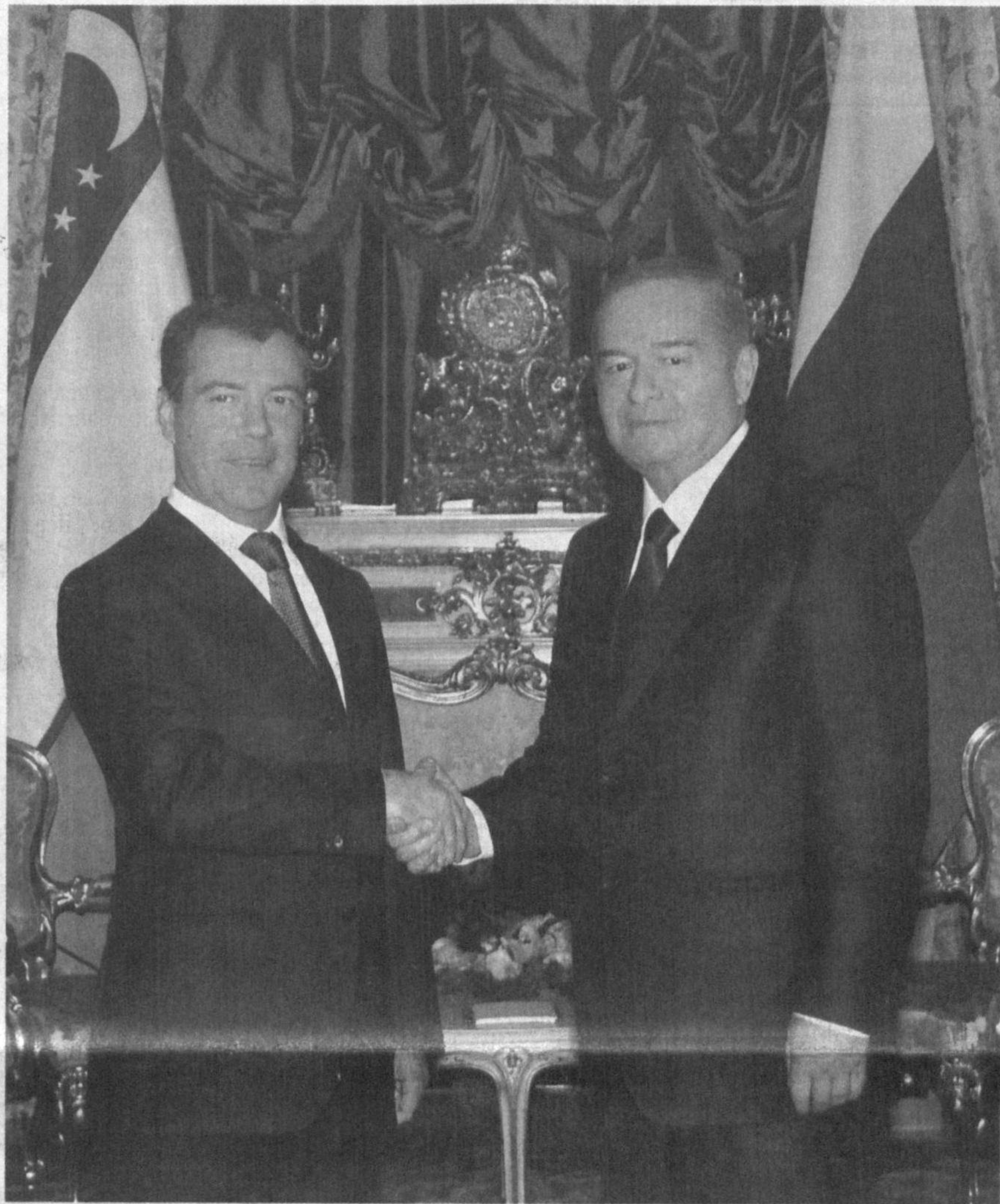
Как сообщалось ранее, Президент Республики Узбекистан Ислам Каримов по приглашению Президента Российской Федерации Дмитрия Медведева 19-20 апреля посетил Россию с официальным визитом

Основная часть визита началась 20 апреля в Кремле со встречи Ислама Каримова и Дмитрия Медведева в формате один на один. В ходе переговоров состоялся обмен мнениями по вопросам дальнейшего развития узбекско-российских отношений, расширения сотрудничества в рамках международных структур, по интересующим стороны проблемам регионального и международного значения, смягчения воздействия и преодоления последствий мирового финансово-экономического кризиса. Во внешней политике Узбекистана отношения с Россией, а во внешней политике России - отношения с Узбекистаном имеют особое значение. Между нашими странами в 2004 году подписан Договор о стратегическом партнерстве, в 2005 году - Договор о союзнических отношениях. Нынешнее сотрудничество развивается на основе данных документов. Следует