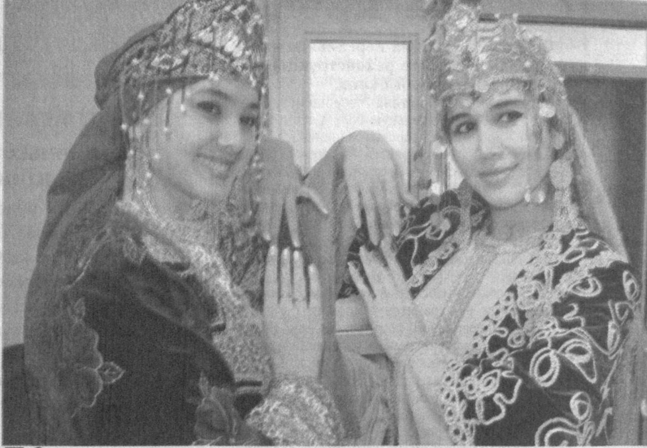
На гастролях в Турции.

Своим представлением "Мгновения вечности" творческий коллектив украсил международные праздничные программы и гала-концерты, посвященные Наврузу.