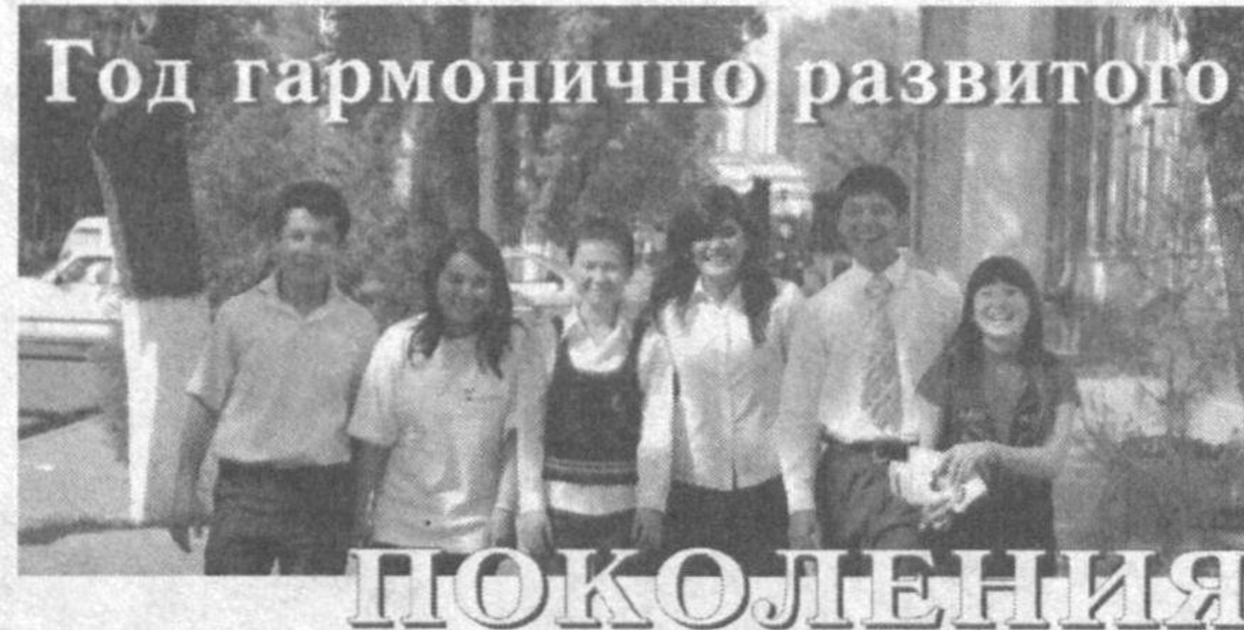
Год гармонично развитого поколения

Джамия Аипова. Корр. "Правды Востока".