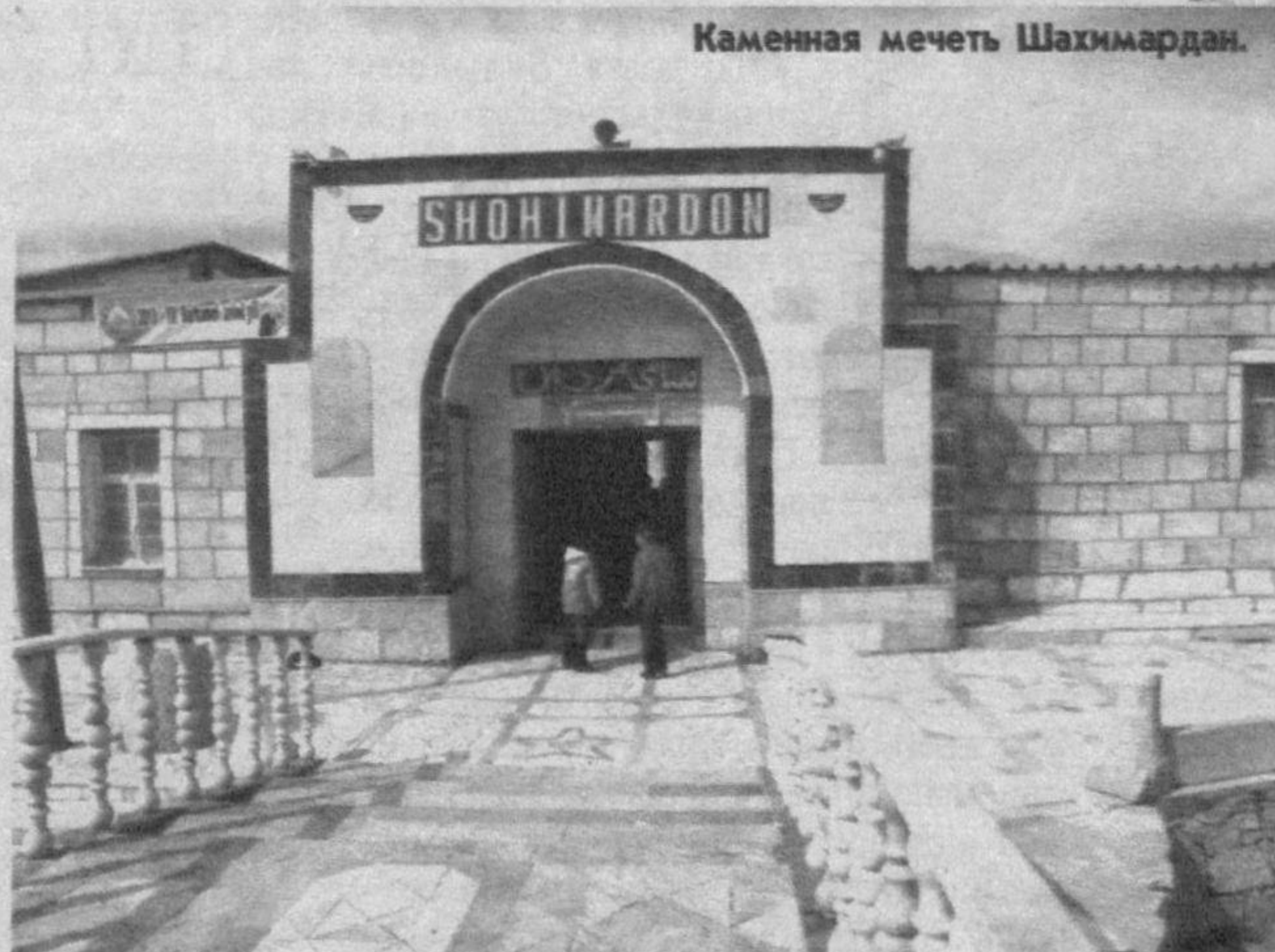
Каменная мечеть Шахимардан.

район Кашкадарьинской области. Большая работа, по словам моего собеседника, предстоит на реставрации комплекса Чашма Нуратинского района, а также мечети Имам Хасан - Имам Хусан,