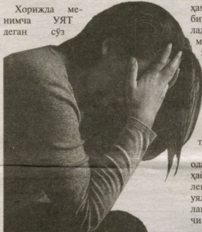
Хорижда ме- нимча УЯТ деган сўз