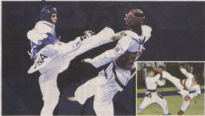
Таеквондисты Ташкентской области активно готовятся к предстоящим международным соревнованиям в режиме онлайн.

Под началом опытных тренеров и специалистов Ташкентского областного управления физической культуры и спорта они отрабатывают приемы, укрепляют мышцы, учатся наносить удары руками и ногами.