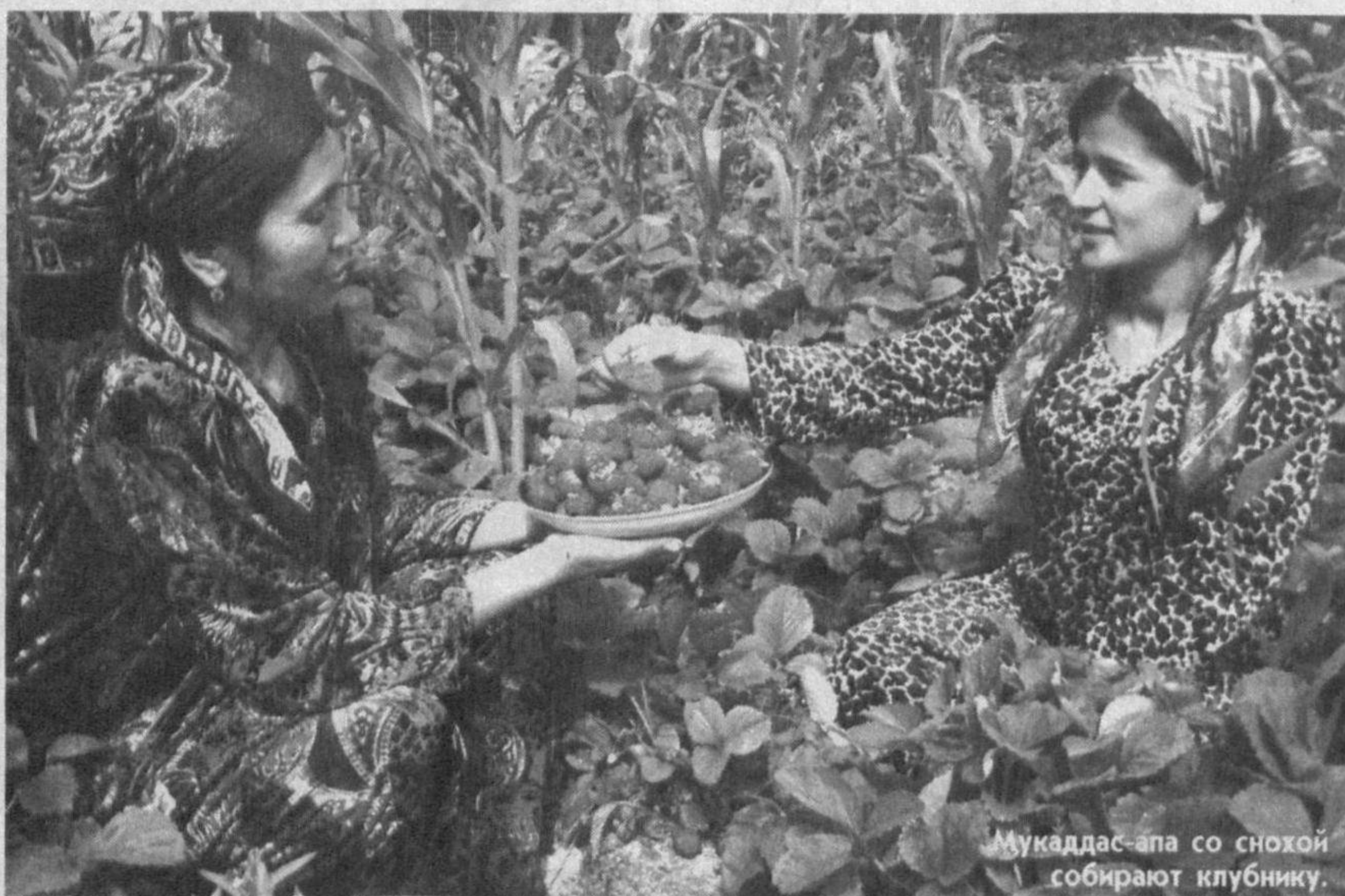
Мукаддас-апа со снохой собирают клубнику.

Личное подворье семьи Эрматовых в кишлаке Курмак Наманганского района - около восьми соток, а доход от него солидный.