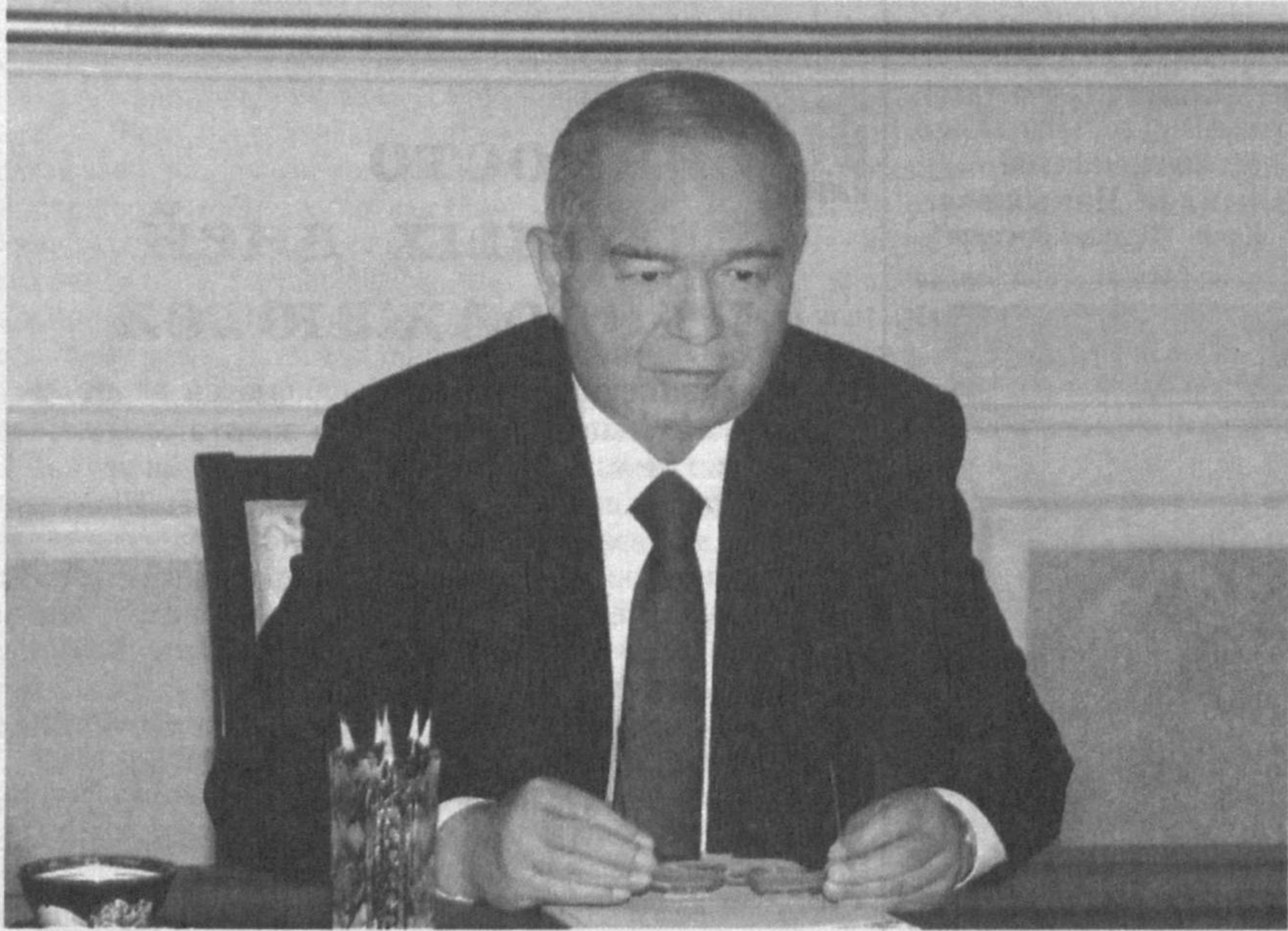
Президент Республики Узбекистан Ислам Каримов 15 июля в резиденции Оксарой принял вице-канцлера, министра иностранных дел Федеративной Республики Германия Гидо Вестервелле.

Глава нашего государства, приветствуя гостя, отметил высокий уровень взаимопонимания и доверия, достигнутый между нашими странами, о чем свидетельствует последовательное сотрудничество узбекско-германского сотрудничества во многих сферах международной политики.