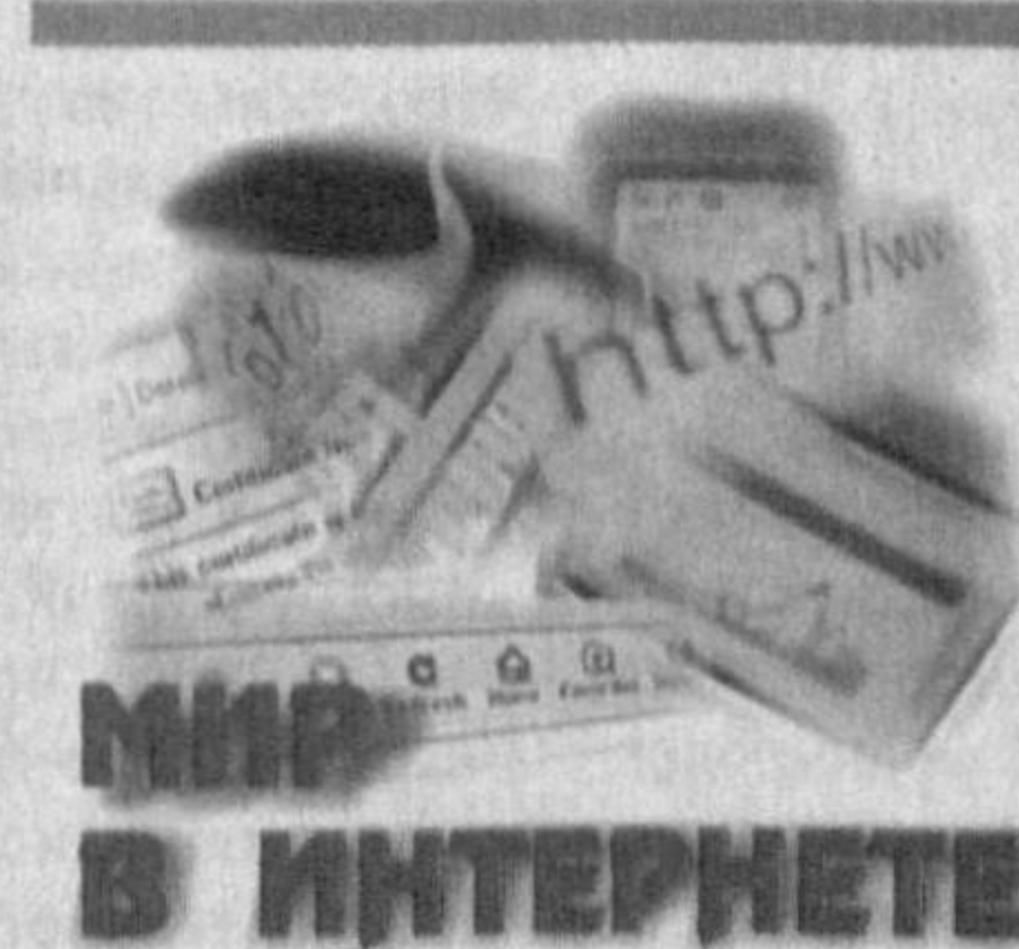
Мир в интернете

жданских дел, около 500 тысяч заявлений о вынесении судебных приказов. По вынесенным судебным приказам взыскано более 174 миллиардов сумов. 90 процентов гражданских дел завершены с вынесением решения, из которых по 95 процентам дел иски удовлетворены. Следует отметить, что в деятельности судов основное внимание уделяется обеспечению верховенства закона и социальной справедливости, претворению в жизнь законов, принятых в процессе осуществления судебно-правовых реформ. (Окончание на 2-й стр.)