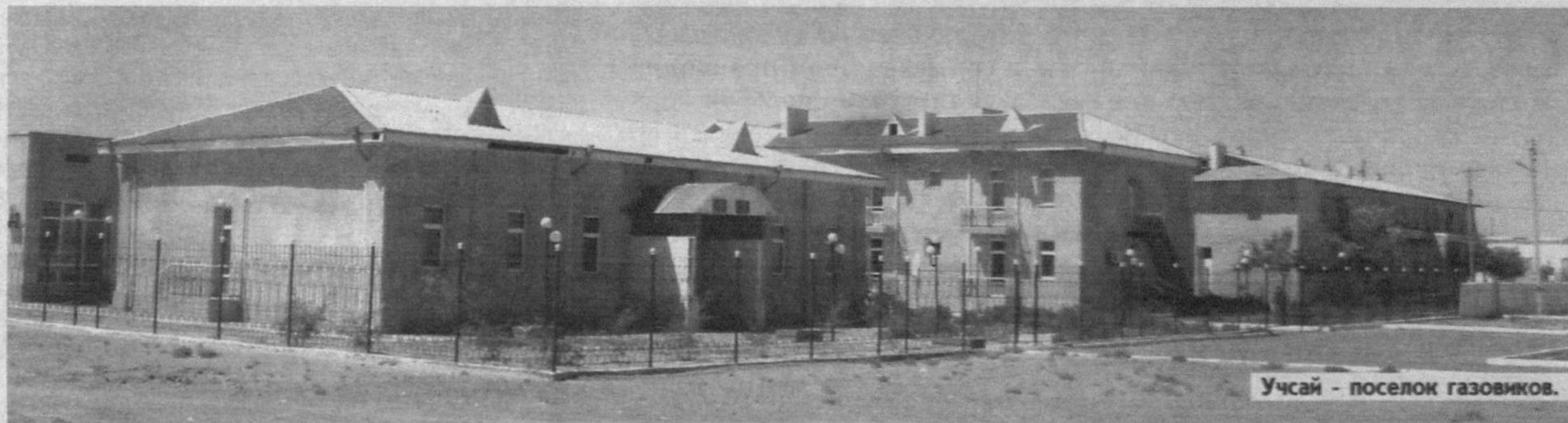
Учсай - поселок газозаводчиков.

Что значило в начале XX века Аральское море как промысловое? Интересы развивающейся российской промышленности и торговли наряду со стремлением расширить границы империи лежали в основе политики дома Романовых в Хиве, Приаралье. А когда был осуществлен большевистский переворот, то новое правительство устремило свой взор сюда. Один весомый пример: в 1923 году аральцы отправили в районы Поволжья и Приуралья, Астраханскую, Пермскую и другие губернии, Татарстану, где свирепствовал сильный голод, 280 тыс. пудов рыбы, в последующие годы - около миллиона пудов. В 1922 году был создан кооператив "Аралец", в который вошли 703 рыбака. Тогда аральская флотилия имела 23 парохода.