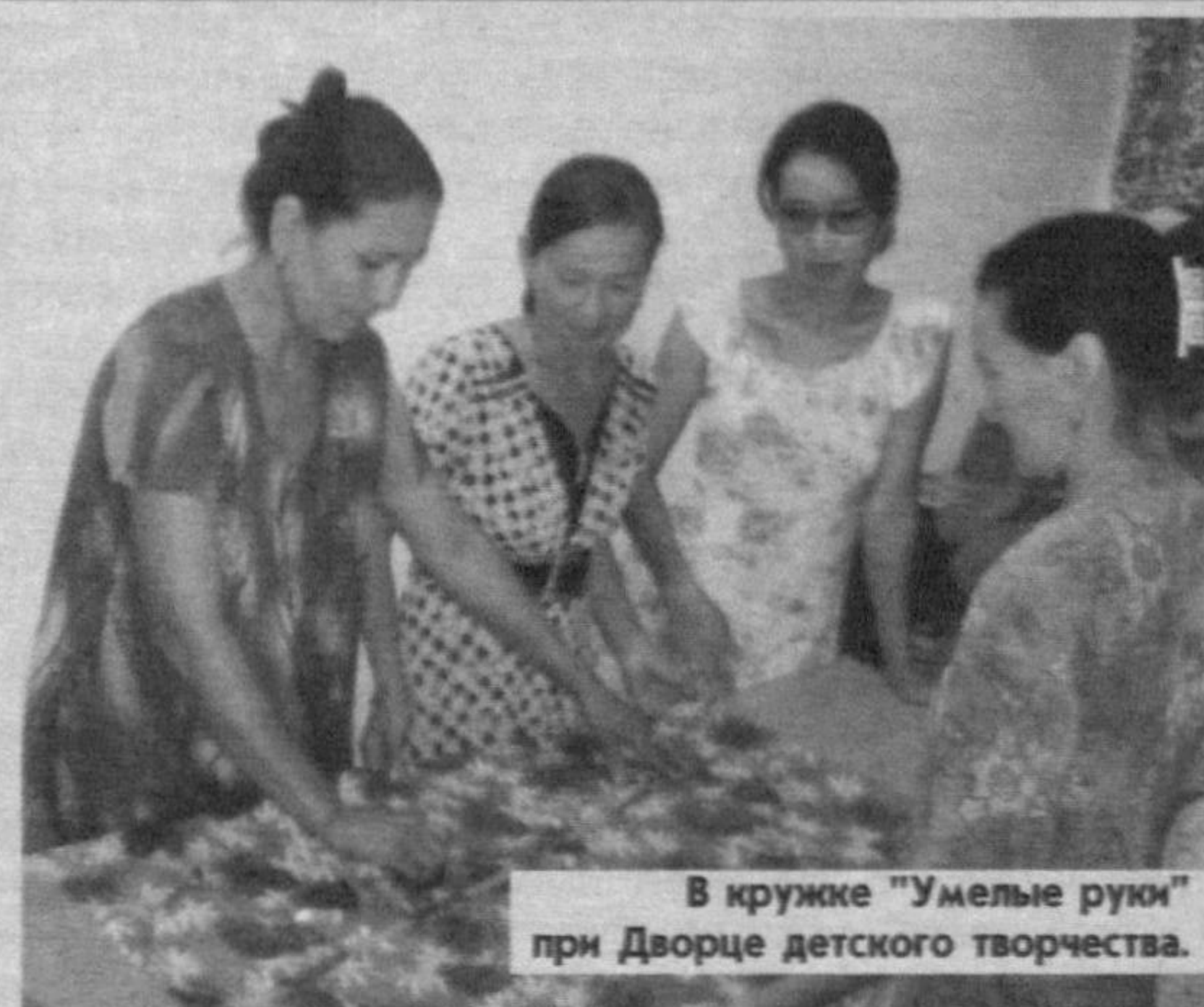
В кружке "Умелые руки" при Дворце детского творчества.