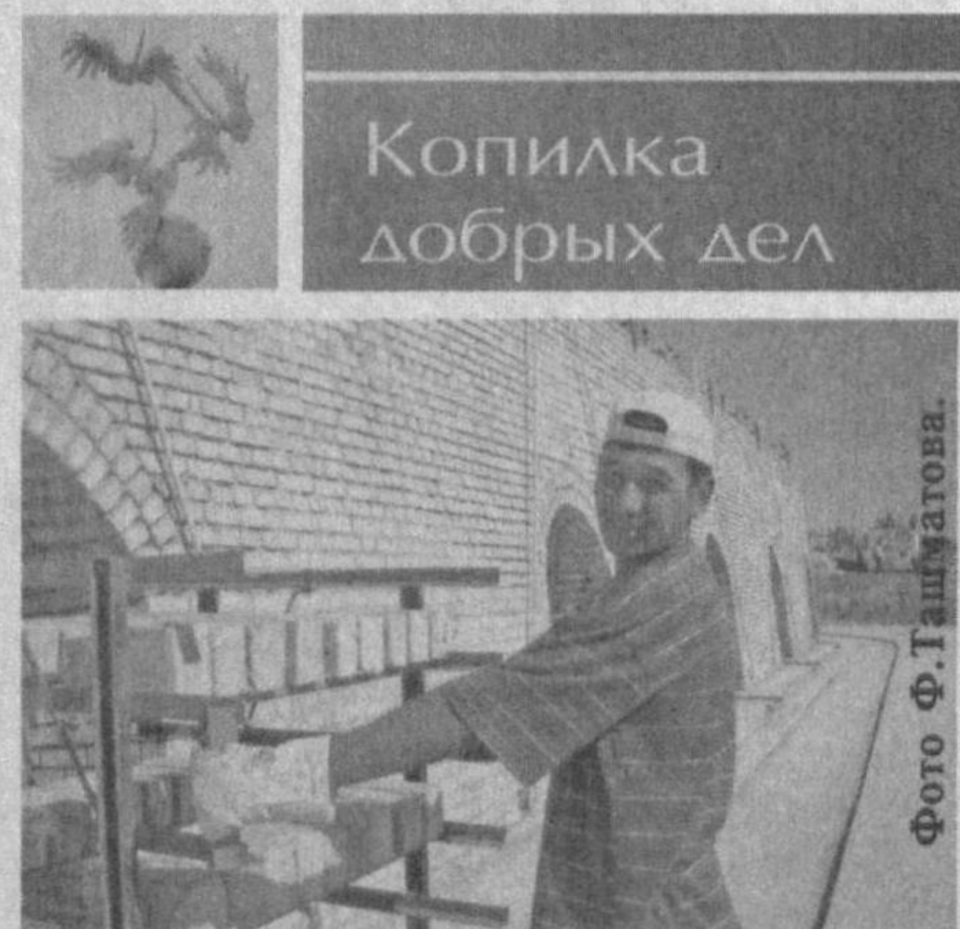
Копилка добрых дел