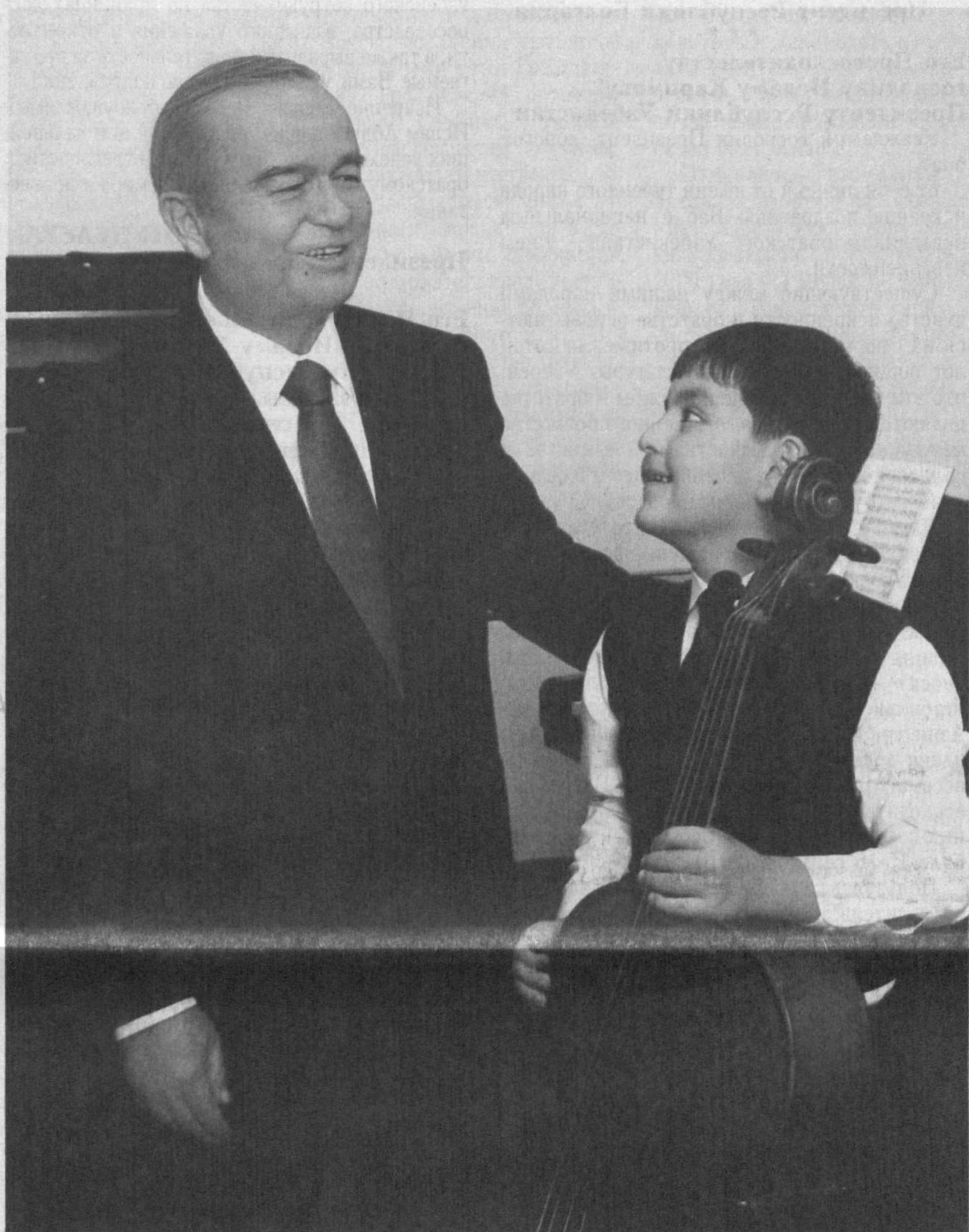
Президент Республики Узбекистан Ислам Каримов 29 августа ознакомился с образовательными учреждениями, сданными в эксплуатацию в столице накануне девятнадцатилетия независимости

Каждый год нашего независимого развития золотыми буквами вписывается в летопись нашей страны как год великого созидания, колос-