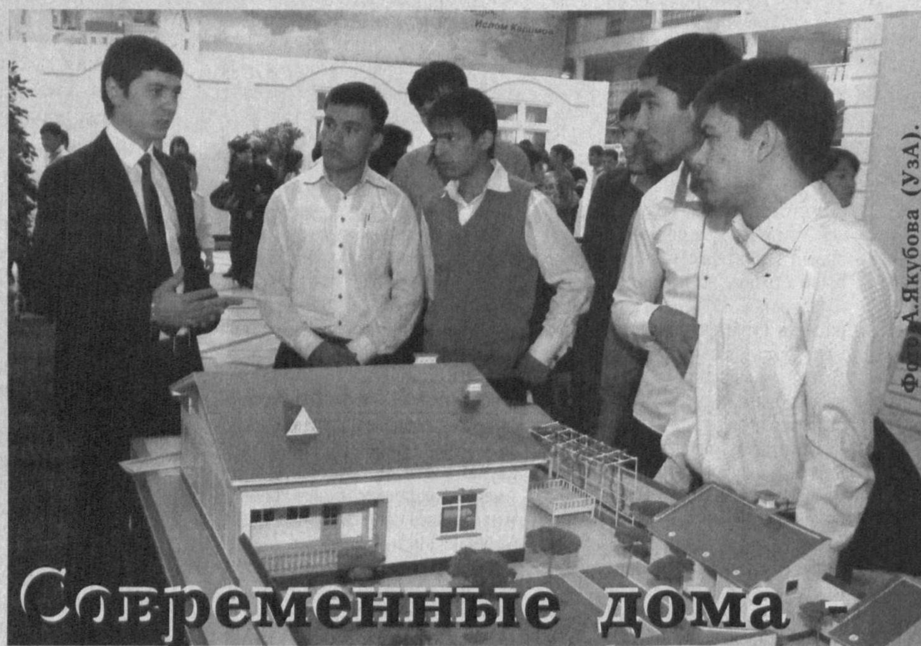
Современные дома - украшение сел