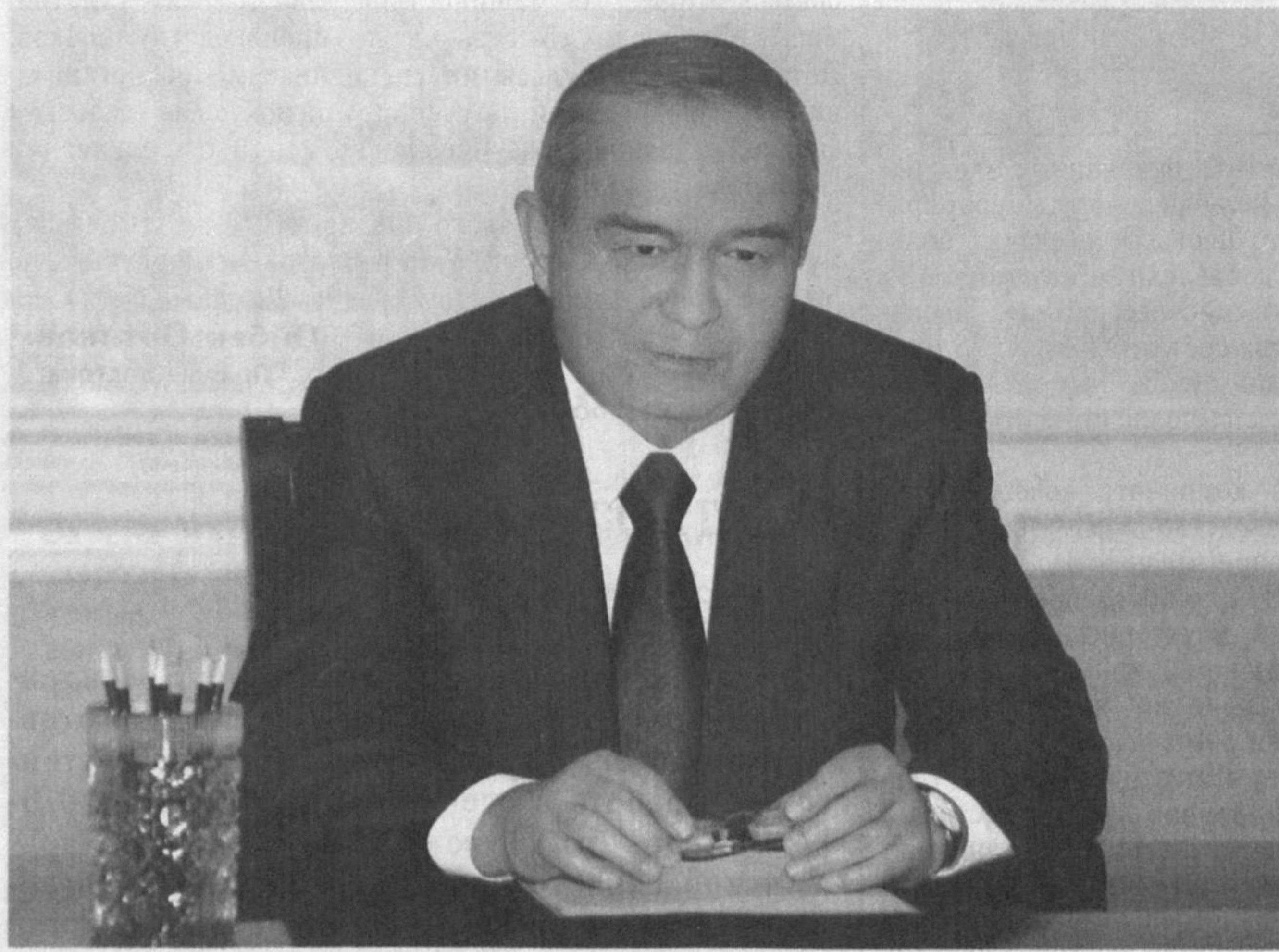
Президент Республики Узбекистан Ислам Каримов 2 ноября в резиденции Оксарой принял Премьер-министра Эстонской Республики Андруса Ансипа.

Приветствуя гостя, глава нашего государства выразил удовлетворение состоянием и уровнем развития узбекско-эстонских отношений.