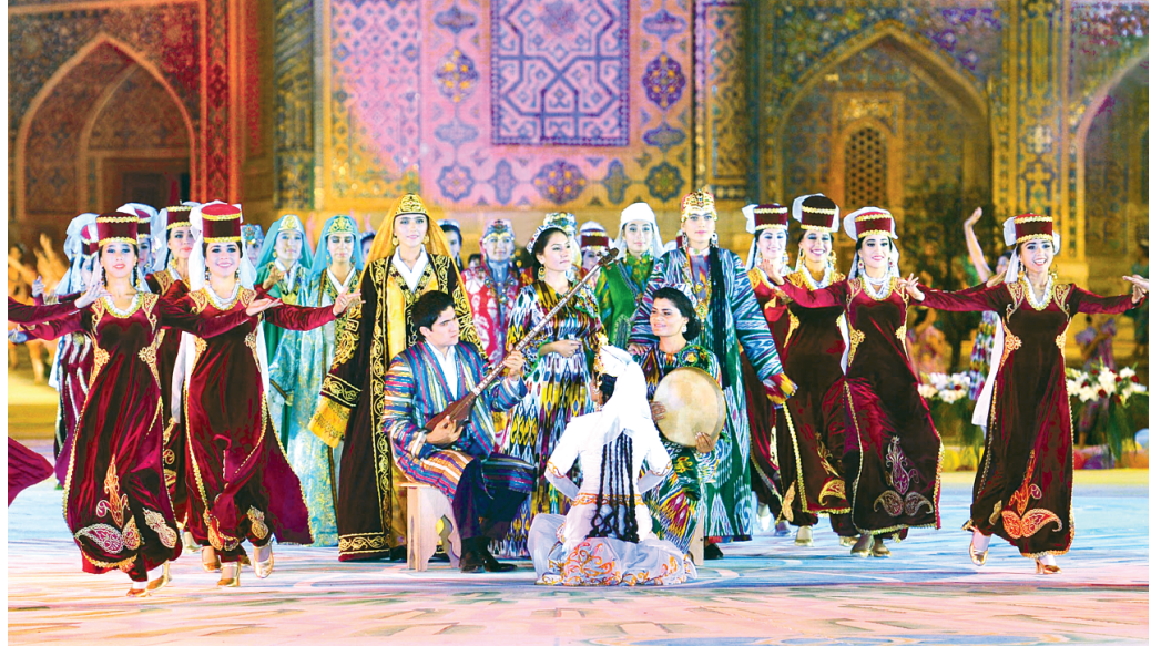
Фото С. Усмонова, Уфа.

Может быть, проще было бы обратиться к великим предкам — Алишеру Навои, Абдурахману Джамии, Наджмиддину Кавкаби, которые метафорически сравнивали музыку и ее высшее проявление — маком — с живым духом, то же, кстати, неподдающимся словесному определению. Ведь важно не само определение, а понять смысл или приблизиться к его пониманию. Как прекрасно это выражено у ученика Джамии и Навои Кавкаби: Нет, не одним мгновением, а веками Божественный свет свой нам лучит, Да, люди мы — земля, вода и камень, Но сердце тронь — и музыка звучит. И так всегда, от века в век, волнуясь, замирая и дыша, Она не спутник жизни человека, она — его бессмертная душа.