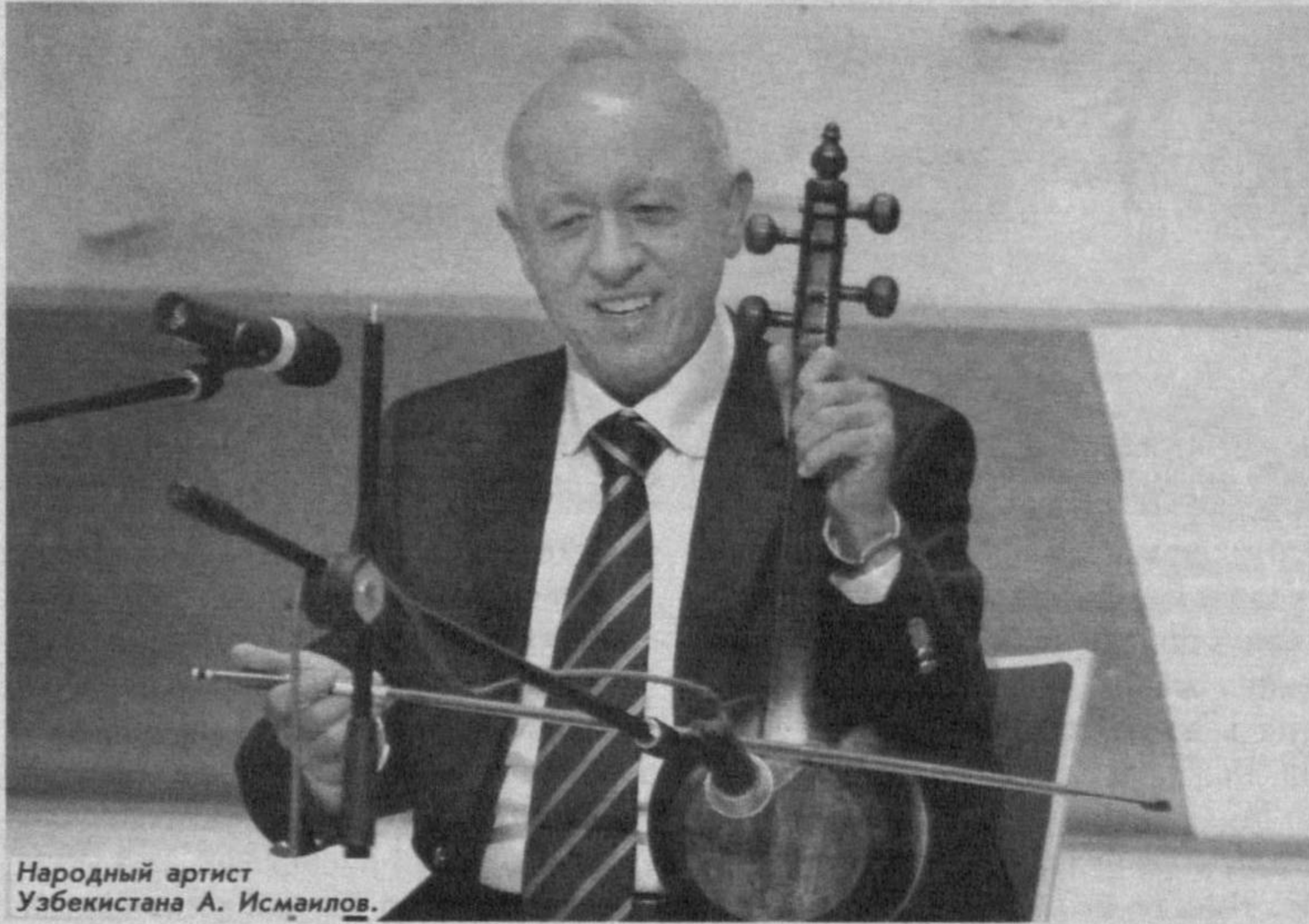
Народный артист Узбекистана А. Исмаилов.

Макомы обладают удивительной силой воздействия на слушателей. Слова, музыка, голос исполнителя, сливаясь воедино, создают неповторимое ощущение гармонии, трогают душу и сердце.