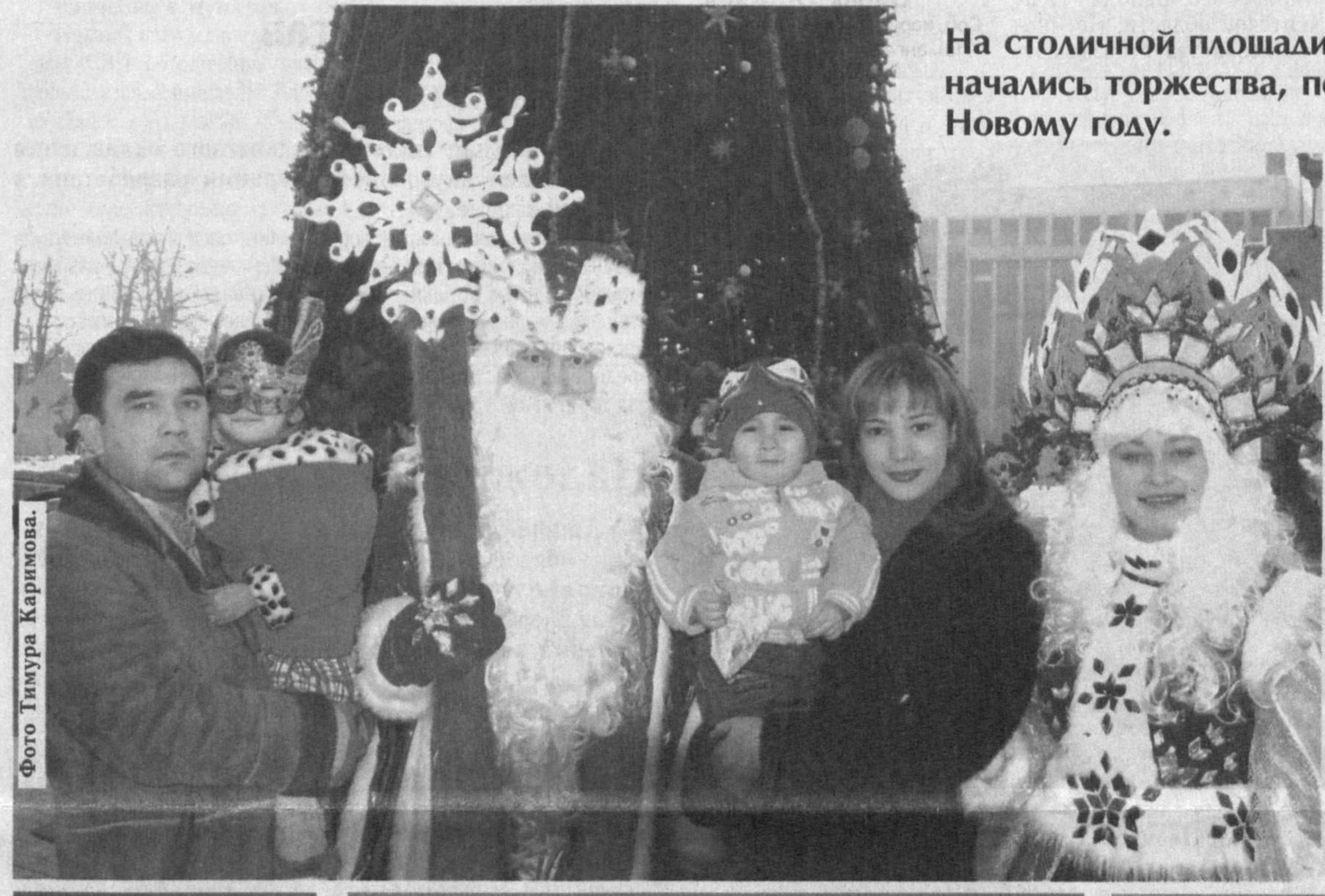
На столичной площади Мустакиллик начались торжества, посвященные Новому году.