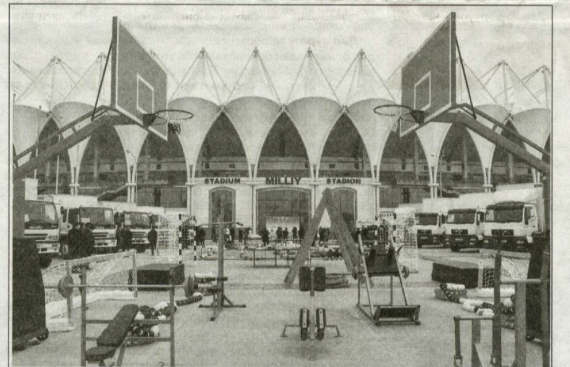
Самти дуоми панҷ ташаббуси муҳиме, ки Президенти Ҷумҳурии Ўзбекистон Шавкат Мирзиёев пешниҳод кард, ин баланд бардоштани маънавияти ҷавонони кишвари мо ва ба роҳ мондани истироҳати турмазунӣ онҳо мебошад, ки ба обутоби ҷисмонӣ ҷавонон, фароҳам овардани шароити зарурӣ баҳри ошкор намудани имкониятҳои онҳо дар соҳаи варзиш нигаронида шудааст. Бояд қайд кард, ки дар давраи сипаришуда дар самти маъмурӣ корҳои васеъмӯҳим амалӣ гардидаанд.

Боре телефонӣ пурсидам, ки кору ҳолаш чӣ хел аст. Гуфт, ки агар имкон дошта бошам, баъди кор дар ягон қаҳвахона вохӯрем ва суҳбат кунем. Розӣ шудам ва баъди кор ба ҷойи ваъдагӣ худро расондам. Аммо Абдурашидро пайдо накардам. Барояш занг задам. Ғишор набардошт. Эҳсоси ниғорон вучудамро фаро гирифт.