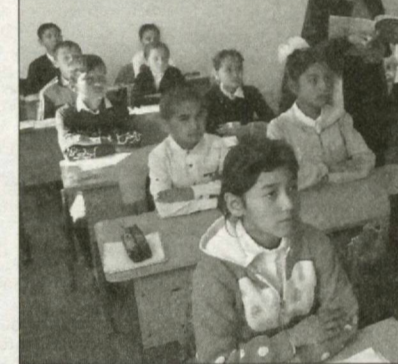
Душворӣ мекашанд. Компютери мактаб кўхна шудааст...