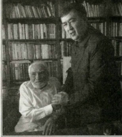
Ҷаёт Неймат дар бисёр конферонсу симпозиумҳои байналхалқӣ...