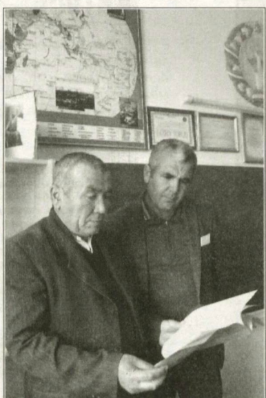
Барои ба ин бино соҳиб гардидан борҳо ба роҳбарони ноҳияву вилоят рӯ овардам...