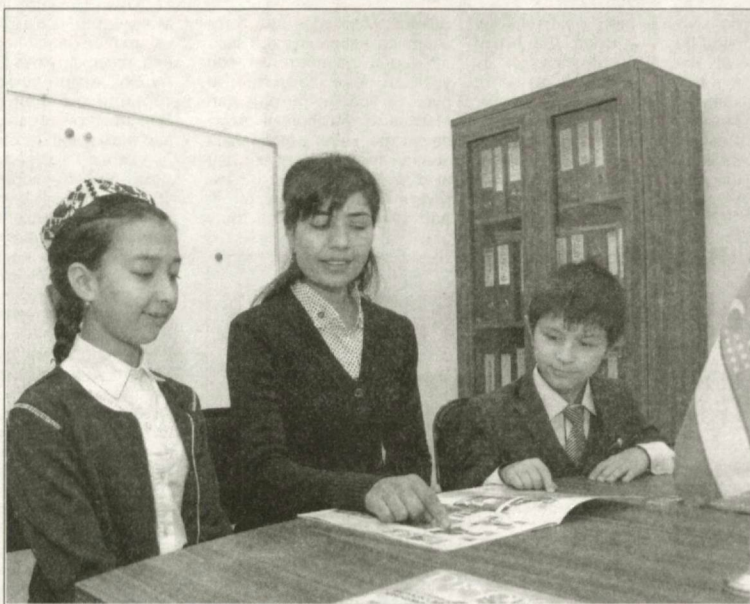
Дар Маркази ҷавонони ноҳияи Олоти вилояти Бухоро 165 нафар писарону духтарон вақти холии худро пурмазмун мегузаронанд. Марказ, ки бо дастгирии кластери «Парвоз Хумо транс равнақи»-и ноҳия сохта, ба истифода супурда шудааст, ба кашф кардани ҷавонони эҷодкору соҳибқобилият, вусъат додани ҷаҳонбинии онҳо, муайян кардани самтҳои фаъолияти минбаъдашон хидмат мекунад. Алҳол дар марказ маҳфилҳои оид ба забонҳои русиву англисӣ, таомпази, омӯзиши компютер, бозиҳои шохҷот ва шашка, гулдӯзӣ ташкил карда шудаанд. Дар сурат: дар Маркази ҷавонони ноҳияи Олоти вилояти Бухоро.