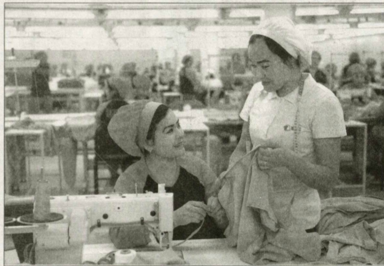
Дар гарнизони харбии Вазорати муҳофизати вилояти Сурхондарё дар байни қадбонҳои оилаи хидматгузарони харбӣ озмун-азназаргузаронии «Балли аёллар» ташхил гардида. Чорабиниҳои мазкур, ки таҳти шиори «Ман қадбонии оилаи харбӣ намунаи ҳастам» баргузор мегардад, барои балианд нуфузи оилаҳои посбонҳои озоиштагии мо дар ҷамъият, дар оилаҳо ҳама тарафа тарбия кардани авлоди баркамол аҳамият дорад. Қадбонҳои оилаи панҷ нафар худими харбӣ, ки дар озмун-азназаргузаронии дар гарнизони Ҷарқўргони гуруҳи идоракунӣ самти оперативӣ ҷанубӣ ташхилшуда ширкат варзиданд, дониш ва малакаи худро ба таври васеъ ба намоиш гузоштанд. Ҷолиб бо диплом, ифтихорнома ва тўғфаҳои хитирмон сарфароз гардидаанд. Дар сурат: лавҳаҳо аз чорабини.