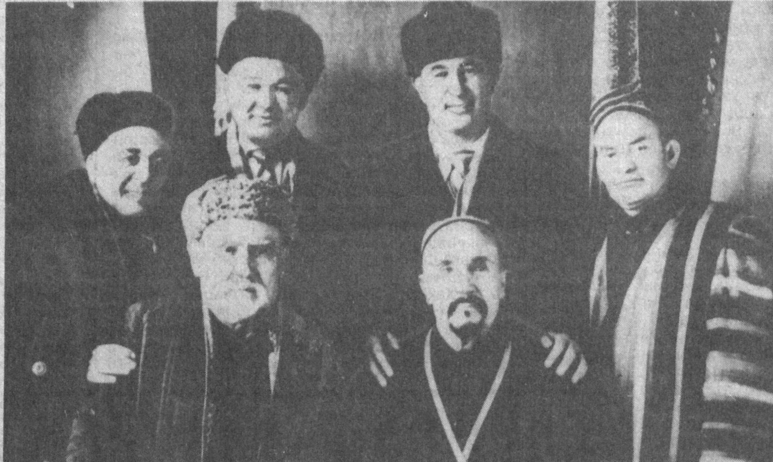
СУРАТДА: (Биринчи қаторда чапдан ўнгга): машҳур созанда Аҳмаджон Умрзоқов; кўплаб аскиячи ва кизиқчиларга устозлик қилган, машҳур сўз устаси Юсуфжон қизиқ Шакаржонов.