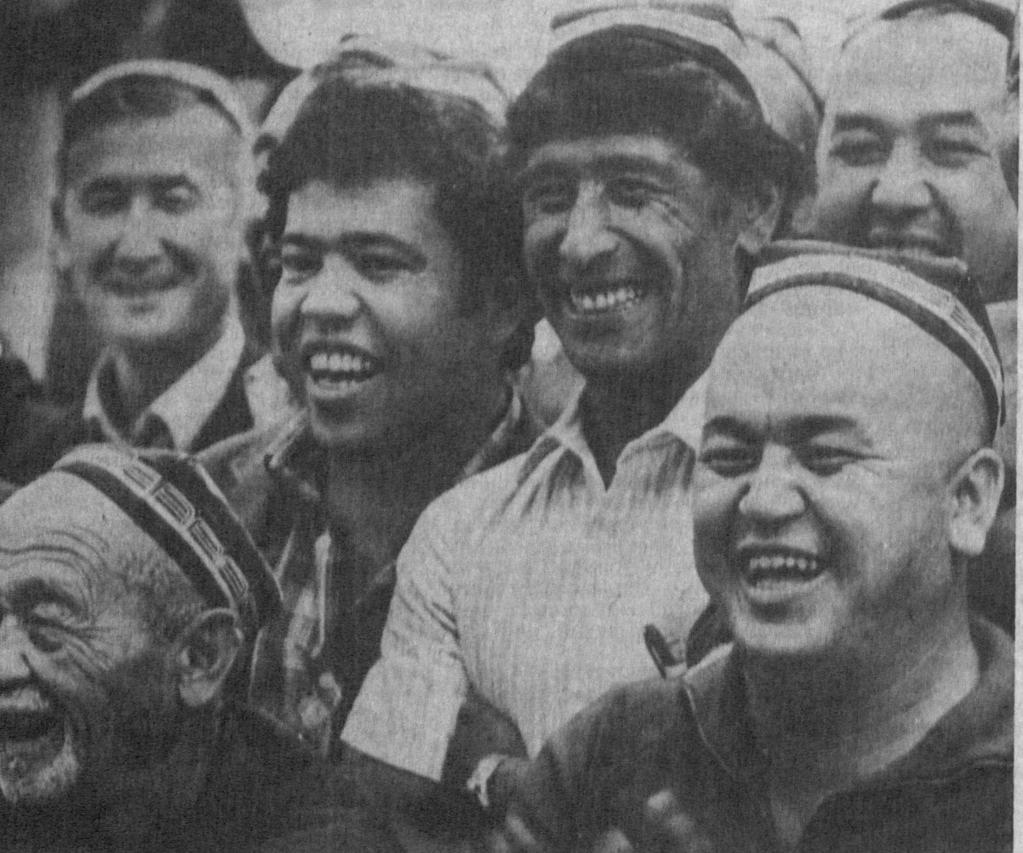
Дилдан яйраб қулганга не етсин.