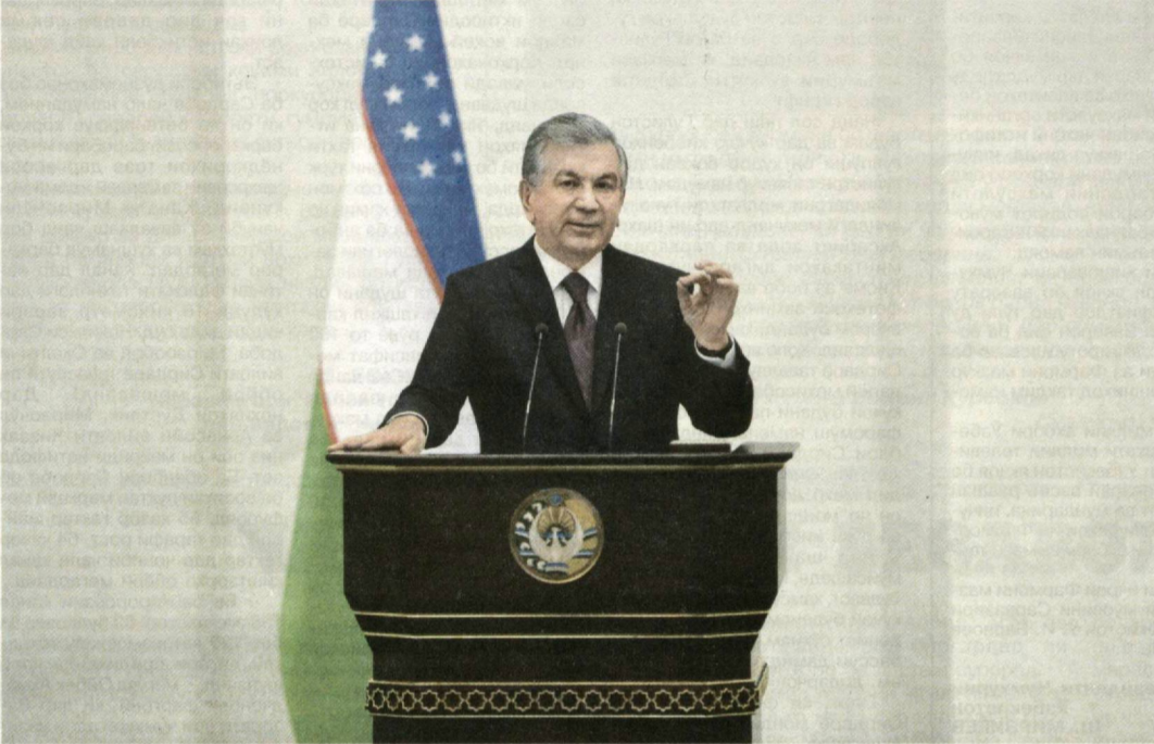
Президенти Ҷумҳурии Ўзбекистон Шавкат Мирзиёев 21-22 май бо мақсади шиносӣ бо қараёни ислоҳоти иқтисодӣ ва ломҳаҳои бузург дар маҳалҳо, мулоқот бо халқ аз вилояти Андиҷон боздид ба амал овард.