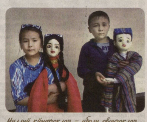
Миллий кўчирчоқлар – ибодат обунчоқлар...