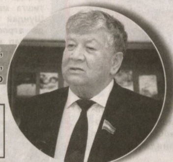
Маҳмуд ТОИР, Ўзбекистон халқ шоири, сенатор

Ўрта Чирчиқ, Чиноз, Янгийўл каби қатор туман ва шаҳарларимиз йўлларидаги реклама, эълонларнинг аҳволини кўринг. Ачинасиз, ғазабланасиз, ўзбеклигингиздан, ўзингиздан уяласиз. Инсон мард бўлиши керак. Зиммасидаги вазифани удалай олмаётими? Қўлини кўксига қўйсин, ўрнини бўшатсин, марҳамат қилиб, ҳа-