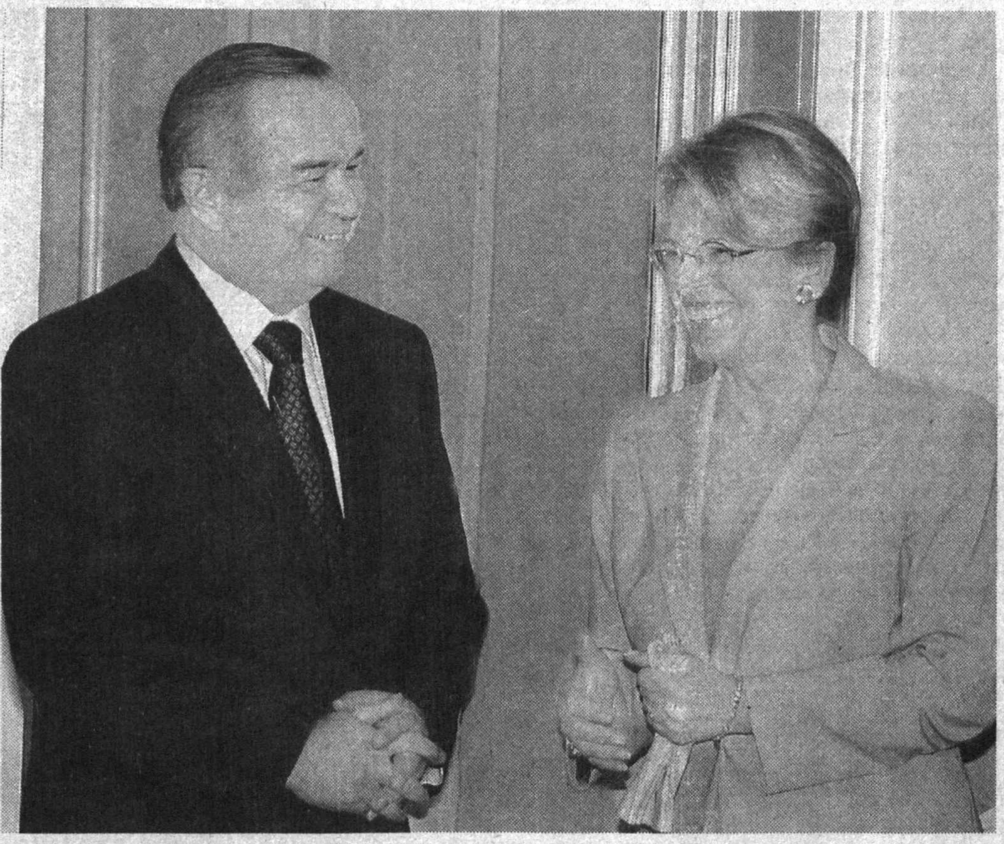
Ўзбекистон Республикаси Президенти Ислом Каримов (сўнг) ва Франция мудофаа вазири Мишел Аллио-Марини (оғир) Оқсаройда қабул қилинганда.