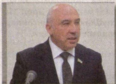
Алишер ШОДМОНОВ, Соғлиқни сақлаш вазири:

– Барча вилоятларда юқори малакали, яъни ихтисослашган мутахассисларга эгамиз. Бундан ташқари, санитария-эпидемиологик осойишталик агентлигининг вилоятларда коронавирус тарқалиши эпидемиясига қандай чек қўйиш кераклигини биладиган мутахассислари бор. Бутунжаҳон соғлиқни сақлаш ташкилоти билан биргаликда тайёргарлик жараёнларини ўрганиб чиқдик ҳамда шундан келиб чиққан ҳолда тегишли чораларни кўриб қўйдик. Вилоятлардаги ҳар битта шифохонада дезинфекция, индивидуал ҳимоя воситалари ва дори-дармонлар захираси яратилган ҳамда пухта тайёргарлик кўрилган.