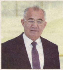
Акмал САИДОВ, Олий Мажлис Қонунчилик палатаси Спикерининг биринчи ўринбосари

Ўзбекистон Республикаси Президенти Шавкат Мирзиёев таъкидлаганидек, инсоният дуч келган пандемия «ўзининг қўли ва миқдасига кўра, мислсиз глобал инқирозга, бутун башариёт тақдир ва жаҳон иқтисодиёти учун ғоят жиддий синовга айланди». Американинг Жонс Хопкинс университети маълумотларига кўра, 2020 йилнинг 24 апрелида дунёда 2,7 миллиондан ортиқ киши коронавирусга чалинган, улардан 191 минг нафарга яқини вафот этган. Коронавирус инфекцияси деярли барча мамлакатларда аниқланган.