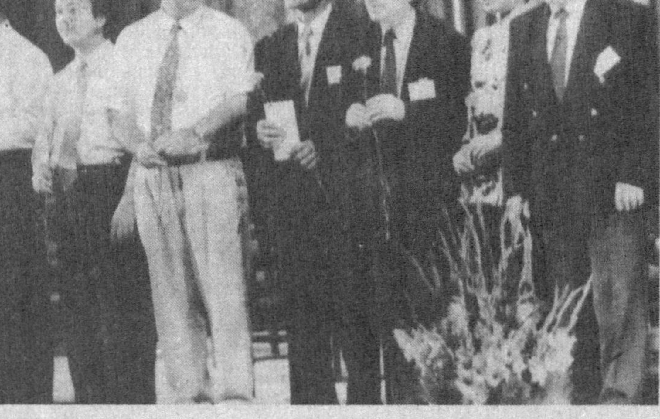
Суратда: фестивал иштирокчилари

Шуни мамнуънинг билан айтиш керакки, фестивалнинг барча концертлари муסיқа илоҳомандларини ўзига мафтун этди. «Туркистон» саройида бўлган биринчи концертини олайлик. Унда Ўзбекистон композиторларининг турли авлодлари ижод этган бир неча йўналишдаги асарлар ижро этилди. Айтайлик муסיқамис оқсоқоли М. Бурҳоновнинг «Алишер Навоийга қасида»си оддий, равшан, қадим оҳанглари огушига етақолини услубда яра-