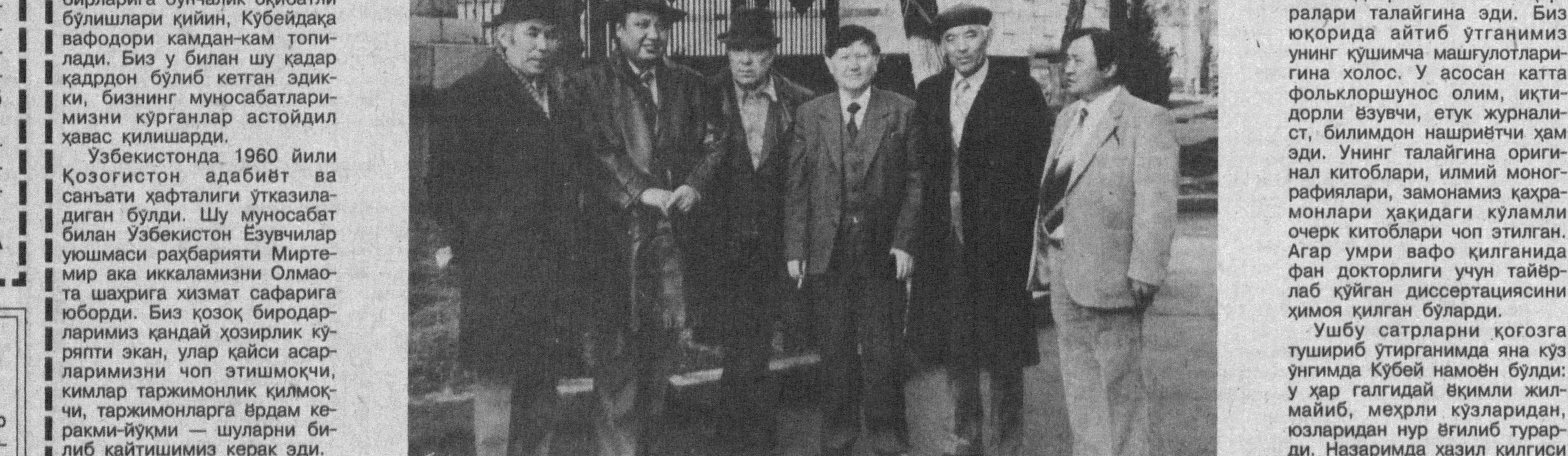
СУРАТДА: (чапдан ўнгга) — Қўбей Сейдахон, қозоқ ёзувчиси Кекелбоев, қозоқ халқ шоири Музаффар Алимбоев, ўзбек адабиёт ширини Носир Фозилов, қозоқ халқ ёзувчиси Азил- хон Нуршайхош, ёзувчи ва драматург Ҳаким Тарозий.

Таваллудига 70 йил тўлиши муносабати билан