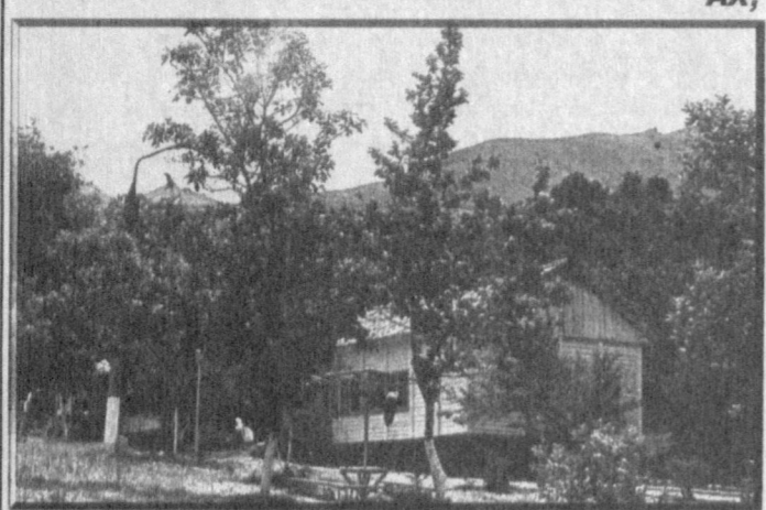
Лагерь «Заркент» расположен в живописном месте в Паркентском районе. Здесь созданы все условия, чтобы мальчишки и девчонки окрепли, набрались сил и здоровья. На терри-