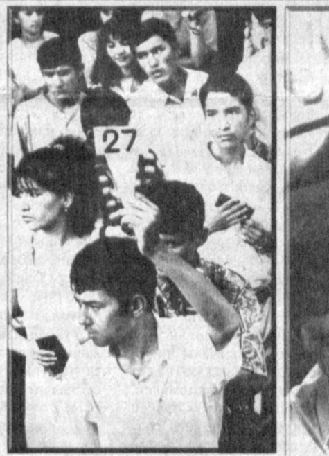
После достижения независимости, внедрения тестовых испытаний в высших и средних учебных заведениях у людей появилась вера в тестирование. У каждого юноши и девушки с хорошими знаниями появилась возможность поступить в высшее учебное заведение. Очередная задача - сохранение этой веры, усовершенствование системы тестирования.