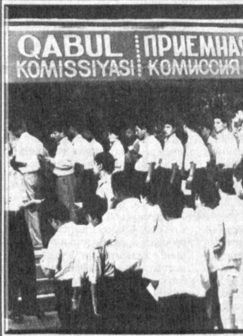
1 августа проходило тестирование в Ташкентском институте текстильной и легкой промышленности. Подано было более двух тысяч заявлений от абитуриентов, причем более 70 процентов от молодежи из областей республики.