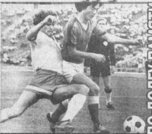
ПО-ДОЛГУ ПАМЯТИ Год за годом отдаляют от нас тот трагический августовский день. О "Пактакоре-79" написано много. Подросли новые поколения болельщиков, для которых "Пактакор" семидесят девятого года - уже история, обратившаяся в легенду

ПОМНИМ... Футболистам ташкентской команды "Пактакор", погибшим в авиакатастрофе, посвящается. Летят года, но боль не утихает, Печаль моя взлетела выше гор, На переплете птицы погибают, Погиб и ты в полете, "Пактакор". За горизонт ушли родные лица, За горизонт родного бытия, Но "Пактакор" мне продолжает сниться, Как будто в том полете был и я. Остались в небе ангелы футбола... И шелест крыл я слышу до сих пор Кудесники мяча, факиры гола... Как я любил тот, прежний "Пактакор". Я помню вас, ребята, поименно, Чтоб часть отдать вам в наши времена, Прозношу колени опроченно С глубокой скорбью ваши имена... (Из книги "Крылья памяти")