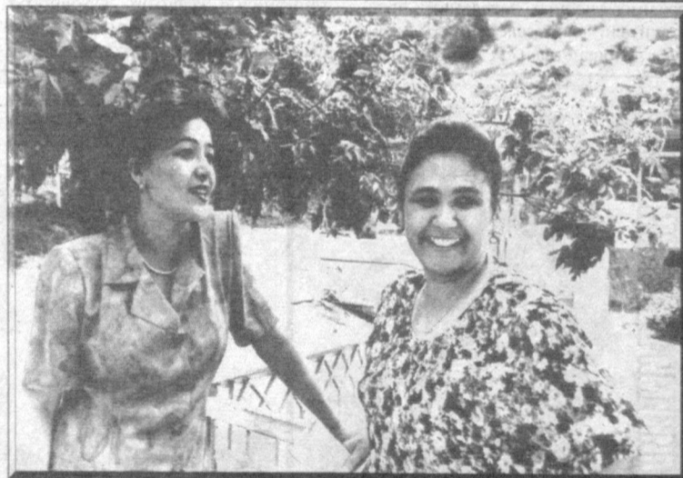
Недавно в доме отдыха Зааминского района прошел семинар творческой молодежи.

В ходе учений планируется отработать вопросы совершенствования системы управления войсками, повышение боеспособности соединений и частей в условиях реформирования и структурного обновления Вооруженных Сил, улучшения взаимодействия Министерства обороны с другими министерствами и ведомствами по обеспечению надежной защиты и безопасности государства, а также охраны и обороны особо важных стратегических объектов и коммуникаций.