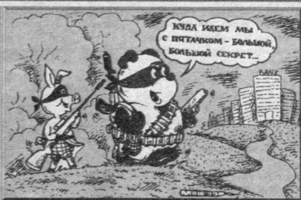
Рис. Александра Маркелова.