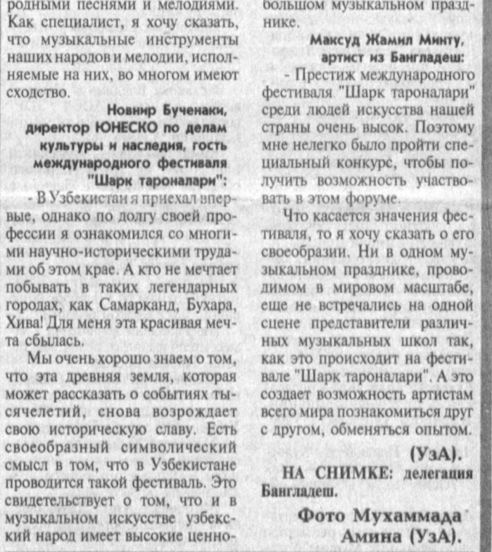
НА СНИМКЕ: делегация Бангладеш.

спасателя И.Юлдашев по просьбе местных властей принял участие в хирургических операциях в городской больнице. Между нашими спасателями, местными органами власти и населением города складываются доверительные отношения. Прибытие узбекских спасателей в Турцию вызвало положительные отклики в турецких средствах массовой информации. Местные газеты "Иени Шафак", "Радикал", "Хуррият", "Дуне" и другие на своих страницах дали подробную информацию о прибытии спасателей и гуманитарной помощи, которую оказывает Узбекистан. Совместные работы наших спасателей оказывают очень высокие результаты в спасении жизней пострадавших в землетрясении Самаркандского автомобильного завода "СамКочаю", размещенный в городе Сакарна. В районе поисково-спасательных работ 24 августа в 19:45 по Гринвичу были зарегистрированы подземные толчки силой до четырех баллов по шкале Рихтера. Спасатели Узбекистана продолжают работу. (УзА).