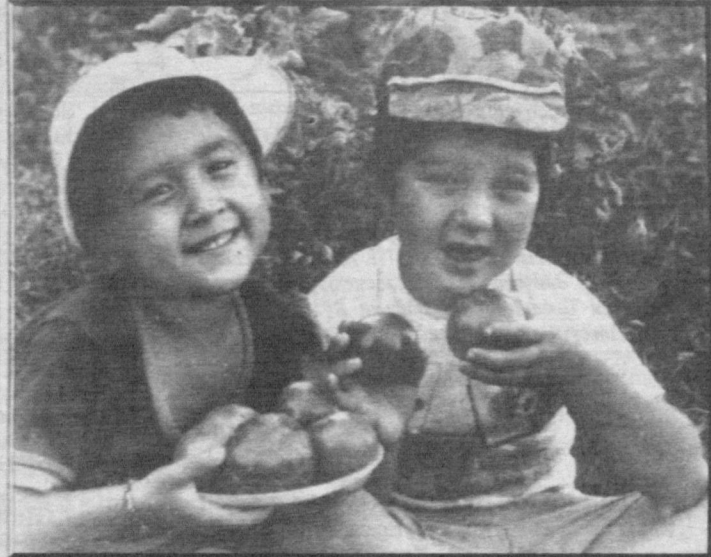
Самый вкусный помидор - с грибами.