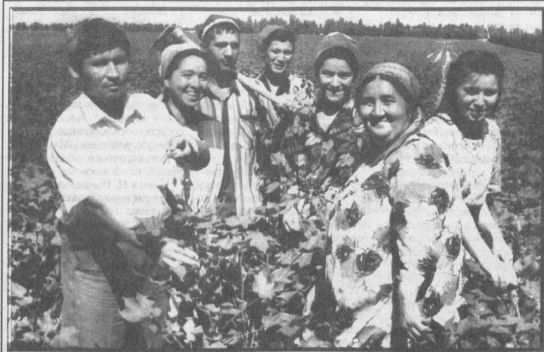
Земледельцы ширкатного хозяйства "Тошкент" Нарынского района обязались нынче продать государству 2110 тонн хлопка, то есть снять с каждого из 665 гектаров по 33,1 центнера. Декане перевыполнили задание по продаже государству зерна, коконов. В эти дни на хлопковых полях ведется междурядная обработка, в почву вносятся минеральные и местные удобрения, ведутся поливы. Посевы хорошо развиваются и накапливают богатый урожай.

УЧРЕДИТЕЛЬ -- КАБИНЕТ МИНИСТРОВ РЕСПУБЛИКИ УЗБЕКИСТАН