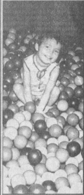
Инвалидность... Тяжелый разговор. Особенно трудно тем людям, которые при болезни сохраняют интеллект: постоянно осознавать свою неполноценность, считать себя обузой для семьи. Не говоря уже об одиноких инвалидах, которые предоставлены сами себе.