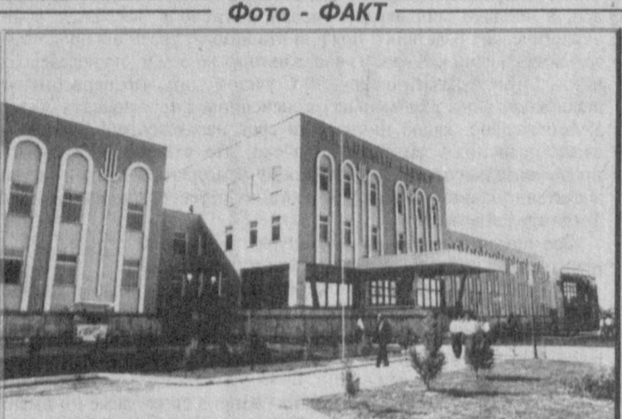
Фото - ФАКТ

Как известно, правительство уделяет большое внимание воспитанию молодежи. Создает все условия, чтобы молодежь овладела прочными знаниями. Это подтверждает и открытие все новых и новых учебных заведений в республике.