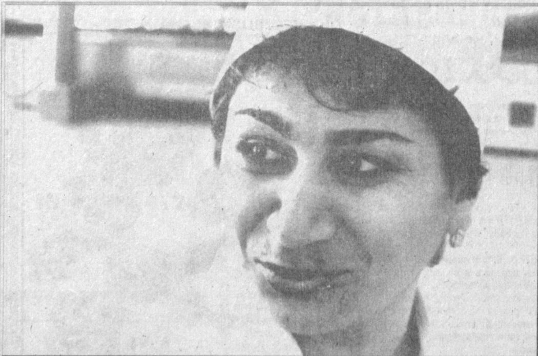
Как известно, красота человека тесно связана с его здоровьем. Не случайно говорят: здоровье - богатство государства. Вы здоровы? Следовательно, вы красивы! Потому что за здоровьем здоровья люди в белых халатах.