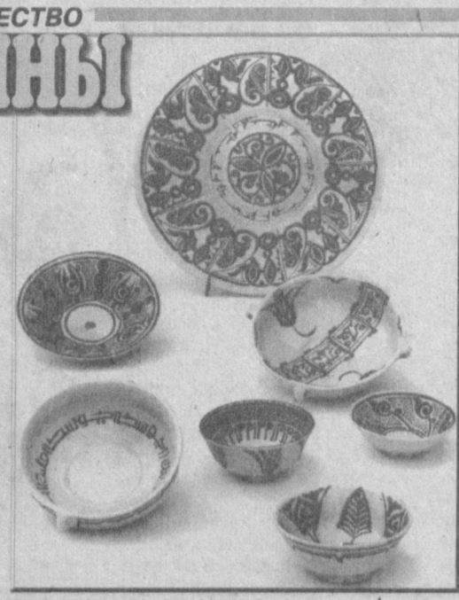
Открытая на днях в выставочном зале Академии художеств.

А то, что талант прекрасного художника-керамиста находится в полном расцвете сил еще раз подтверждает и его сентябрьская выставка работ.