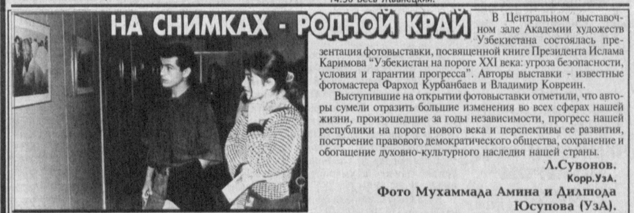
НА СНИМКАХ - РОДНОЙ КРАЙ. В Центральном выставочном зале Академии художеств Узбекистана состоялась презентация фотовыставки, посвященной книге Президента Ислама Каримова "Узбекистан на пороге XXI века: угроза безопасности, условия и гарантии прогресса". Авторы выставки - известные фотостудии Фарход Курбанбаев и Владимир Ковренев.

11.15 Служба спасения. 11.40 "Полудра". 12.10 "КОНАН". 13.35 Большие деньги. 14.05 "Последняя коммуна". 14.20 НТВ штурмует форт Бай-яр. 15.30 "ОНА НАПИСАЛА УБИЙСТВО". 16.25 "Русские горки". 17.25 "Жизнь замечательных зверей". 17.55 "Криминальная Россия". Фильмы 1-й и 2-й. 19.00 Итого. 19.55 "КЛАССИК". 20.30 Куклы. 23.45 "ЕВРОПА". 9.05 Дорожный патруль. 9.20 Мультифильм. 9.30 "ТЕАТР СКАЗОК". 11.20 "Как стать звездой!" с Сергеем Сивохой. 11.55 Диск-канал. 12.30 Канон. 13.00 Шесть новостей недели. 13.30 Star start. 14.30 "Равнодушие". 16.30 "Спартак" - чемпион! 17.15 "Знак качества". 17.55 Бес вопросов... 18.25 Катастрофы недели. 19.50 "Бис". 20.25 "Вы - очевидец". 20.55 "Обозреватель". 21.55 "СКОЛЬЖЕНИЕ". 23.40 Нава музыка: Михаил Шуфутинский. 0.45 ТСН-спорт. 1.00 "БЕЗЖАЛОСТНАЯ ПОПУТЧИЦА". 9.00 Детский телеканал. 10.15 Перевоспитание. 10.25 Смотрите на канал. 10.30 "СПАСАТЕЛЬ МАКГАЙВЕР". 11.30 Слово и дело. 12.00 "События". 12.15 "С утра попозже". 12.45 "Малыш и Карлсон". "Карлсон вернулся". 13.25 "ЦУ возвращается...". 15.20 "Грани". 16.50 "СКАЗКА НА НОЧЬ". 18.35 Мультифильм. 18.55 "Особая папка". 20.00 "Загадочная сила". 21.35 "ПО ГЛАВНОЙ УЛИЦЕ С ОРКЕСТРОМ". 23.25 События одной строкой. 23.30 "Спортивный экспресс". 0.00 "ПРАКТИКА". 0.50 "КРОВНЫЕ БРАТЬЯ".