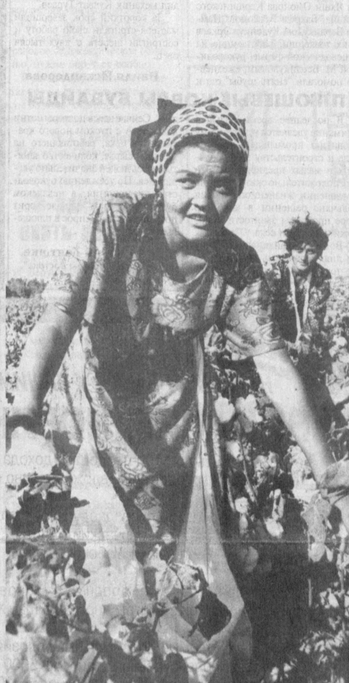
Земледельцы кооперативного ширкатного хозяйства "Фарход" Хавастского района обязались нынче сдать государству 6,5 тысячи тонн "белого золота" с 3250 гектаров.

У уборочной дехкане приступили организованно и прилагают все усилия, чтобы выполнить задание к 5 октября.