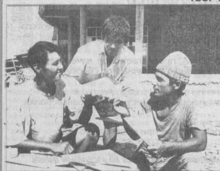
Город Нукус украсит еще один музей. Это музей Бердаха. Он построен в современном и национальном стиле. Сейчас ведутся последние работы. Строит этот музей коллектив 315-й механизированной передвижной колонны. В ближайшее время музей примет первых посетителей.