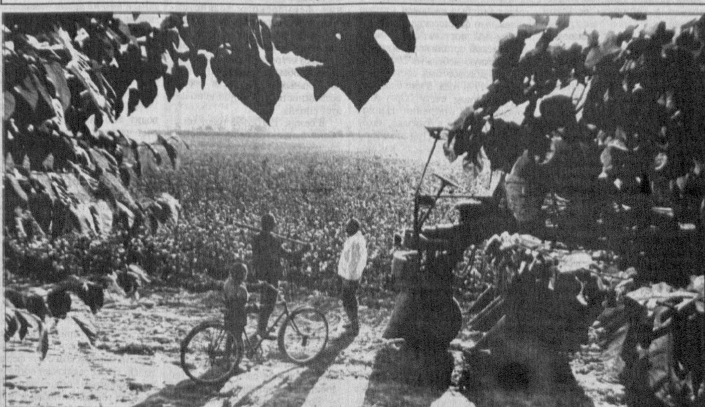
Ждет поле механизаторов.

Юрий Гентшке. Соб. корр. "Правды Востока".