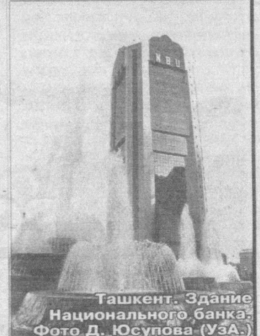
Ташкент. Здание Национального банка.

Материал передан при содействии Центральноазиатского представительства корпорации NEC в Ташкенте.