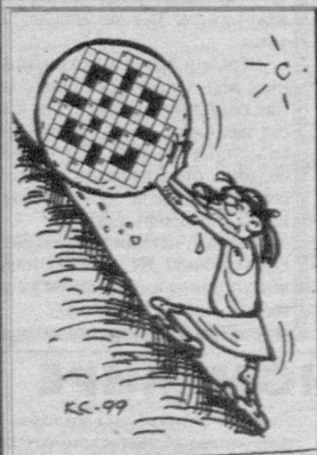
Рис. В. Капрельянца.