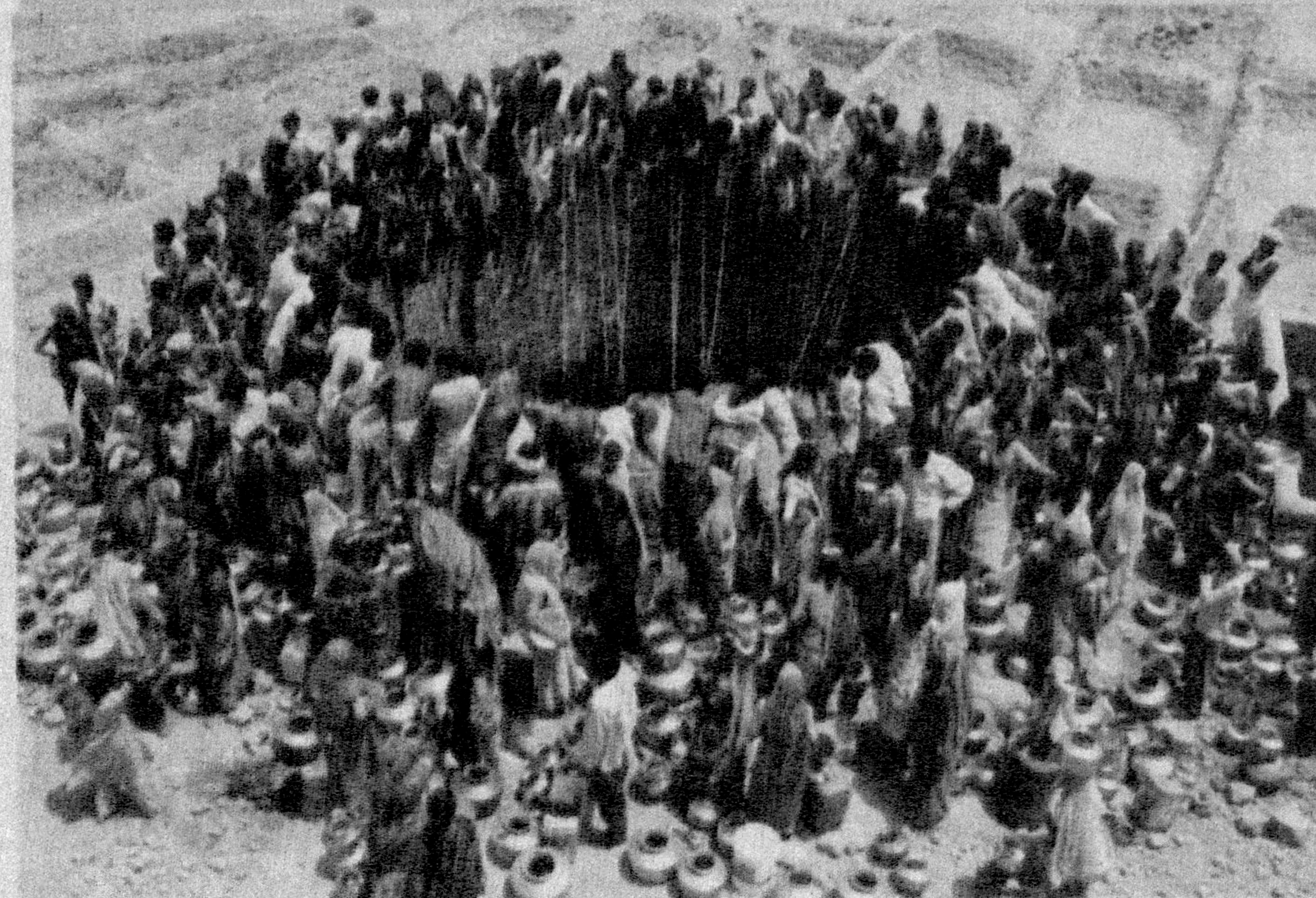
Ҳиндистоннинг Гужарат штатидаги Натваргад қишлоғи аҳолиси ниҳоятда кўп бўлишига қарамай битта қудуқдан сув ичади. «Дунё қудуғи»дан баҳраманд бўлаётган етти миллиард аҳоли ҳам бундай ҳолатдан мустасно эмас. «Карвон кўп, ризқи бўлак» деганлари шу бўлса, керак-да?!

БМТ мутасаддилари «тилла бола» расман Рус ўлкасида туғилганини тасдиқлашди. Чақалоқ Калининград шаҳрида 31 октябрь кунин Москва вақти билан тунги 00:02 да дунёга келган. 3 килограмм 600 грамм вазн билан туғилган (бўйи 50 сантиметр) болакай айна пайтда шифокорлар назоратида парварिश қилинмоқда. Аммо мурғак Пётрнинг рақобатчилари ҳам йўқ эмас. Масалан, Россия Президентининг Узоқ Шарқ минтақасидаги ваколатли вакилининг матбуот хизмати етти миллиардинчи инсон 31 октябрь кунин соат 00:19 да Петропавловск-Камчатка шаҳрида туғилди, деб хабар тарқатган. 3 килограмм 600 грамм