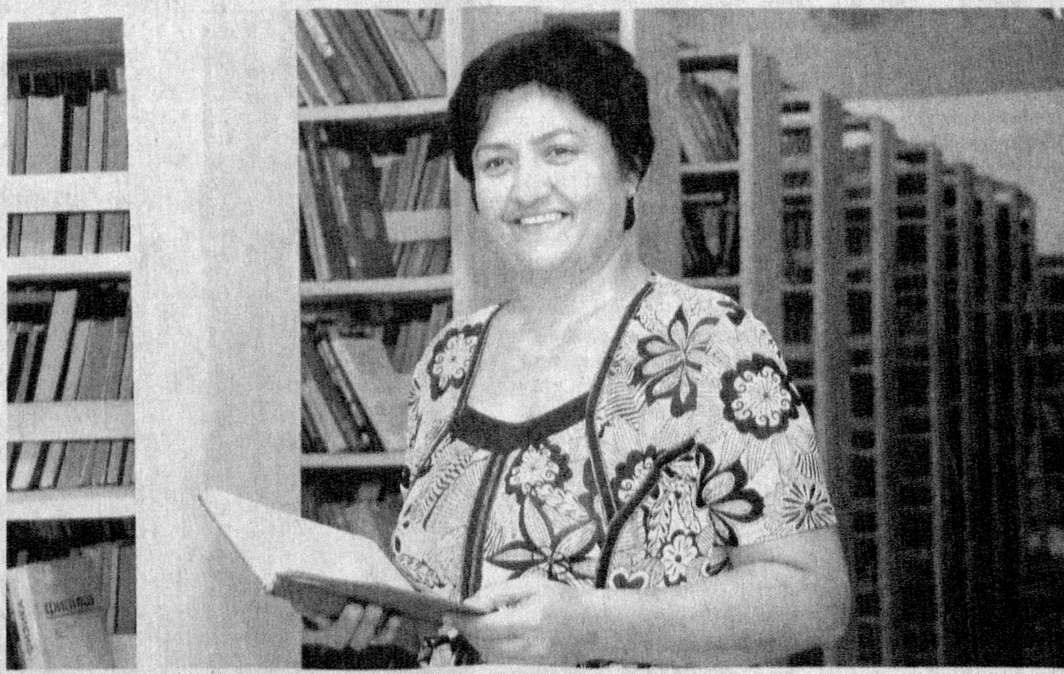
Давлатимиз раҳбарининг 2006 йил 20 июнда қабул қилинган «Республика аҳолисини ахборот-кутубхона билан таъминлаш ташқи этиш тўғрисида»ги қарори асосида ўсиб келаётган ёш авлоднинг интеллектуал эҳтиёжини таъминлаш, кутубхона хизматини янада такомиллаштириш, аҳолининг кенг ва тизимли ахборот олиши учун зарур шарт-шароит яратиш ишлари давом этмоқда.

нашрларига обуна бўлиш, янги адабиётларнинг каталогини шакллантириш, китобхонларни ҳисобга олиш, бюрютма ва китоб берилиши каби хизматларнинг барчаси электрон-автоматлаштирилган тарзда олиб боришмоқда.