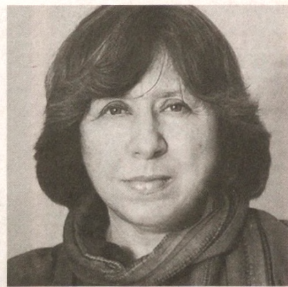
Светлана АЛЕКСИЕВИЧ (1948), белорус адибаси, Нобель мукофоти соҳибаси

(“Урушнинг аёлдан йироқ қиёфаси” қиссасидан)