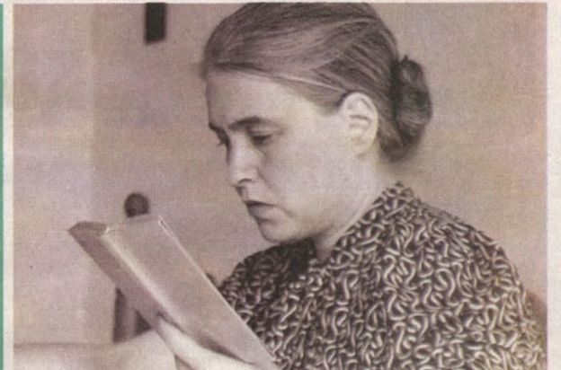
Анна ЗЕГЕРС (1900-1983), немис адабаси

Антон Шулц гитлерчилар армиясида унинг биринчи кундан охиригача асарлик қилди; урушнинг охиригача у асир ҳам тушди, лекин орадан анчагина йиллар ўтгач, уйига эсон-омон қайтиб келди. Келса, хотини, учала ёш ўғилчининг ҳам тан-жонлари омон экан, оталик қалби қувонди.