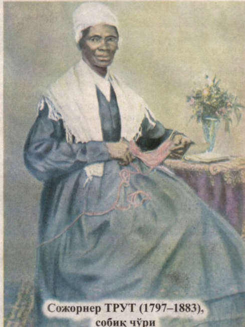
Сожорнер ТРУТ (1797-1883), собиқ чўри

Шеърлари маҳаллий ва халқаро миқёсдаги 90 та антологияда нашр этилган ва дунёнинг ўнлаб тилларига таржима қилинган.