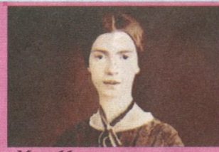
Муҳаббат – ҳамма нарса. У ҳақда биладиганимиз шу, ҳолос. Эмили ДИКИНСОН