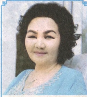
Халима ХУДОЙБЕРДИЕВА, Ўзбекистон Халқ шоири

№ 04 (317) 2020 йил 8 март. Газета ҳар ойнинг иккинчи ва тўртинчи чоршанбасида чоп этилади.