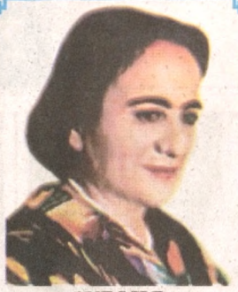
ЗУЛФИЯ, Ўзбекистон Халқ шоири

Гулу райхонларнинг таралди атри, Самони қоллади майин бир кўшиқ. Бу кўшиқ нақадар ошно, яқин, Нақадар ҳаётбахш, оташга тўлиқ. Баҳорги бурканган сен севган элда, Овозинг янгради жўшқин забарласт. Ўлмаган экансан, жоним, сен ҳаёт, Мен ҳам ҳали сенсиз олмадим нафас. Хижронинг қалбимда, сўзинг кўлимда, Ҳаётни куйлайман, чекинар алам. Тулар тушимдасан, кундуз ёлдам, Мен ҳаёт эканман, ҳаётсан сен ҳам!