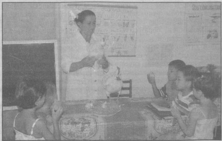
В оздоровительном дошкольном образовательном учреждении № 7 «Олтин балыкча» Ромитанского района Бухарской области малыши узнают много полезного и интересного, что может пригодиться в их жизни.