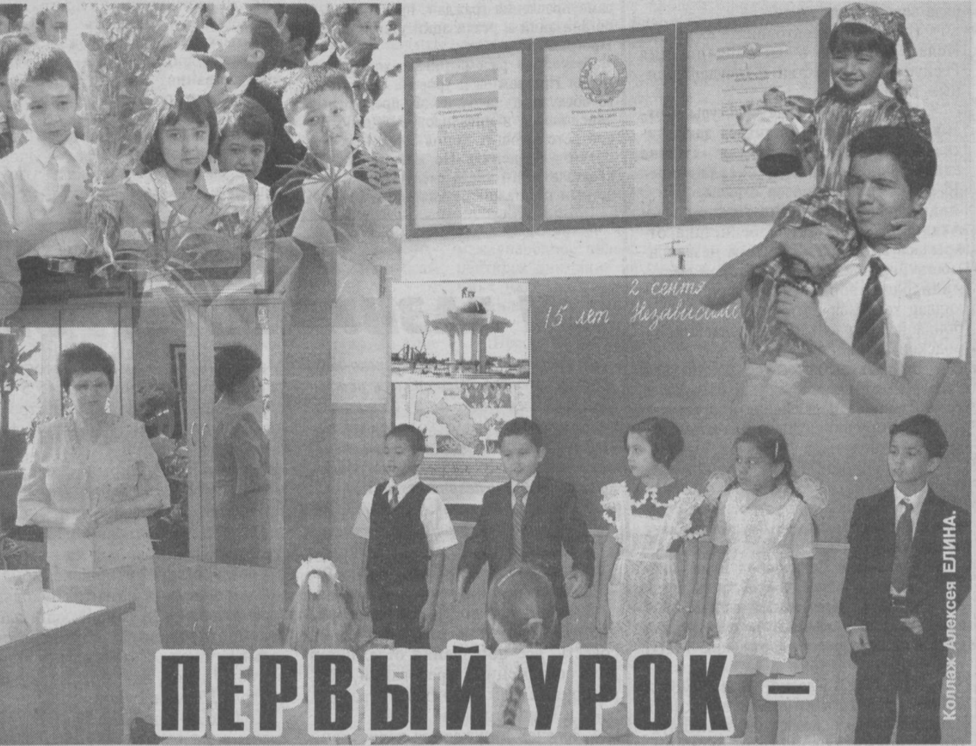
Коллаж Алексея ЕЛИНА.