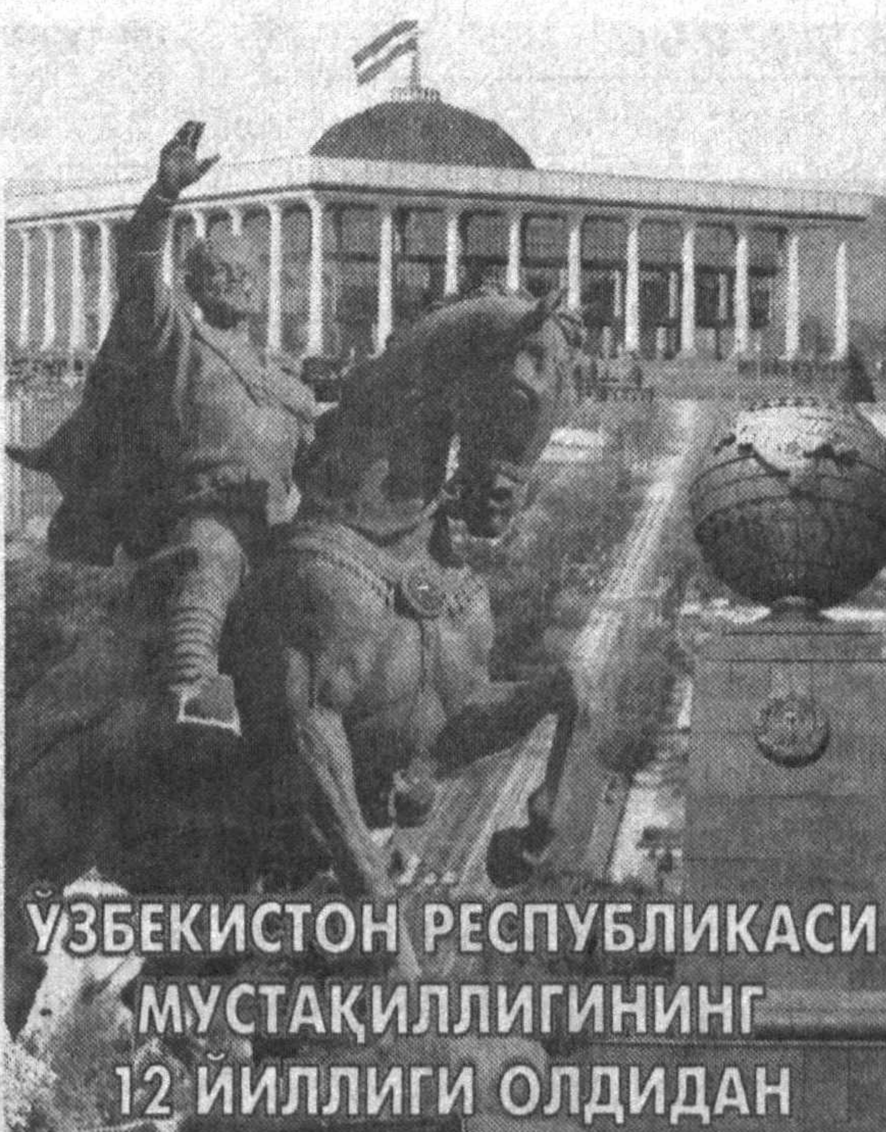
ЎЗБЕКИСТОН РЕСПУБЛИКАСИ МУСТАҚИЛЛИГИНИНГ 12 ЙИЛЛИГИ ОЛДИДАН