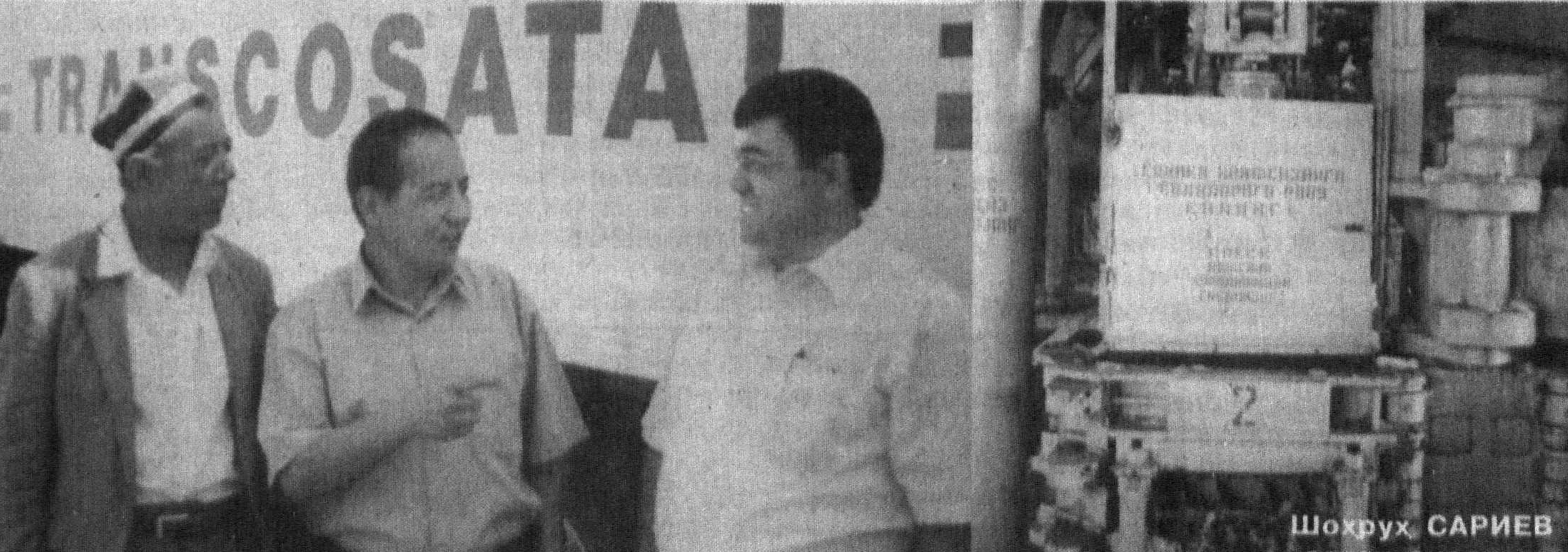
Пайларик туманидаги «Челак пахта тозалаш» ҳиссдорлик жамиятида 360 нафар ишчи меҳнат қилади. Уларнинг барчаси махсус кийим-кечаклар билан таъминланган, зарарли иш шартларида ишловчиларга алоҳида меҳрибонлик кўрсатилмоқда. Шунингдек, корхонада оммавий маданий-спорт тадбирларини ўтказиш ҳам яқини аниқланаётган. Қувончлиси, бу каби тадбирларни уюштириш ва қатта кўтаринкилик билан ўтказишда бошланғич касаба уюшма ташкилоти ташаббускорлик кўрсатмоқда. Айни кунларда ҳиссдорлик жамиятида янги махсусга пухта тайёргарлик ишлари якунига етмоқда.