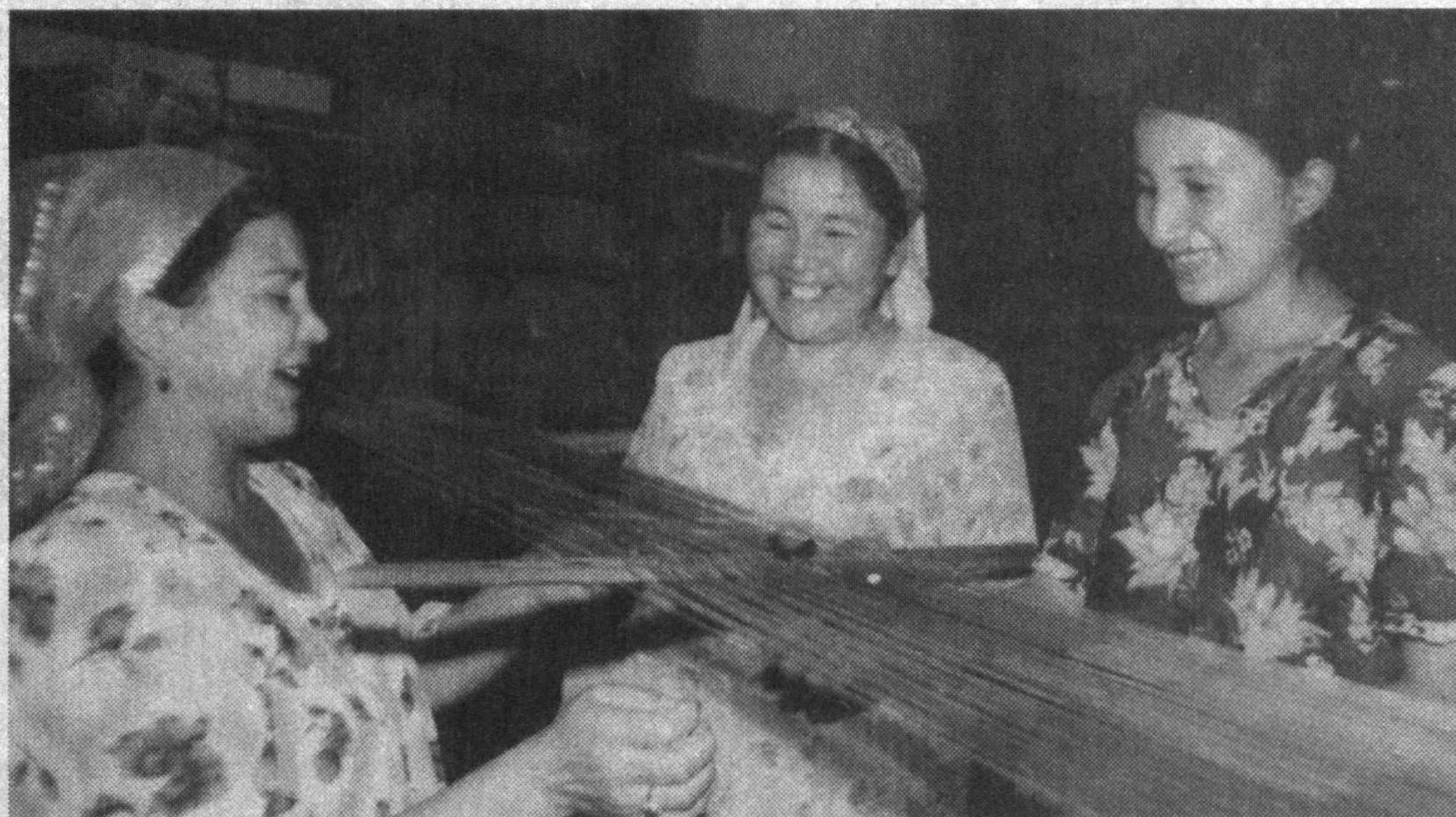
Хунармандчилик - халқимизнинг азалий касби. Каштачилик, зардўзлик, тикувчилик, гилам тўқиш каби ҳўнар сирлари авлоддан-авлодга ўтиб келмоқда. Улар яратган турли-туман хонатлас, қўлда тўқилган гиламлар, чиройли сўзаналар барчанинг эътиборини тортади. Атлас - ўзбек матоси. Атлас - миллий либосимиз. Шу боис бу матони яратиш қанчалик меҳнат талаб қилса, унинг шарафи ҳам шунчалик баланддир. Марғилон шаҳрида фаолият кўрсатаётган «Едгорлик» фирмаси маҳсулотларига эътибор қундан-қунга ортмоқда. Бу ерда маҳаллий хомашў - пилладан ишлаб чиқарилаётган хонатлас, шойи, адрас, бўз, гилам каби маҳсулотлар сифати, бежиримлиги ва турлитуманлиги билан ҳам харидордир.