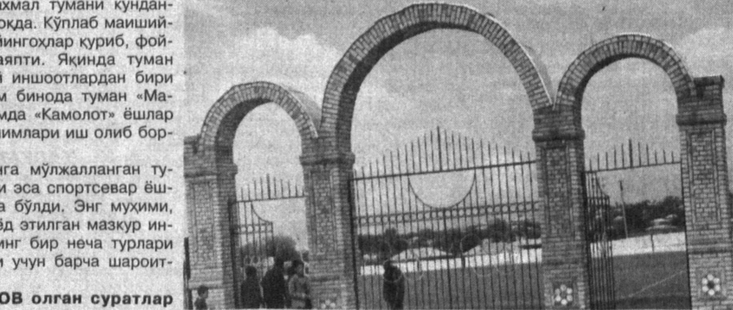
Б.НОРКУЛОВ олган суратлар

Шифокорнинг бир дақиқа ичида беморга ёрданини бошқа бироя буйи беролмаслиги мумкин. Шунинг учун ҳам бу касб ағалари эъзозда. Дардида шифо топганлар халоскорини умр буйи эсдан чиқармайди, дуо қилиб чарчамайди, кўринганга мактайдй. Лекин, беш панжа баробар эмас, деганларича бор экан. Янгиарик тумани марказий шифохонасида бош ҳаким бўлиб ишлаб келган Рустам Бобонов Гиппократ касамини унутиб, оқ ҳалатида доғ туширдй. У келди даврон, даврингги сур, қабилида йўл тутди. Яхши ниятлар билан ҳузурига кирган Тўхтажон Жуманиёзовдан, унинг қизи Мавлудани марказий касалхонага ҳамшира қилиб ишга олиш эвазига 100 миң сўм олаётганида пора сўради ва ўз хизмат хонасида 50 миң сўм олаётганида қўлга олдинди.