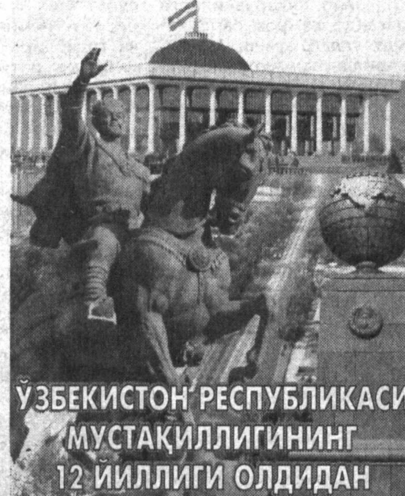
ЎЗБЕКИСТОН РЕСПУБЛИКАСИ МУСТАҚИЛЛИГИНИНГ 12 ЙИЛЛИГИ ОЛДИДАН