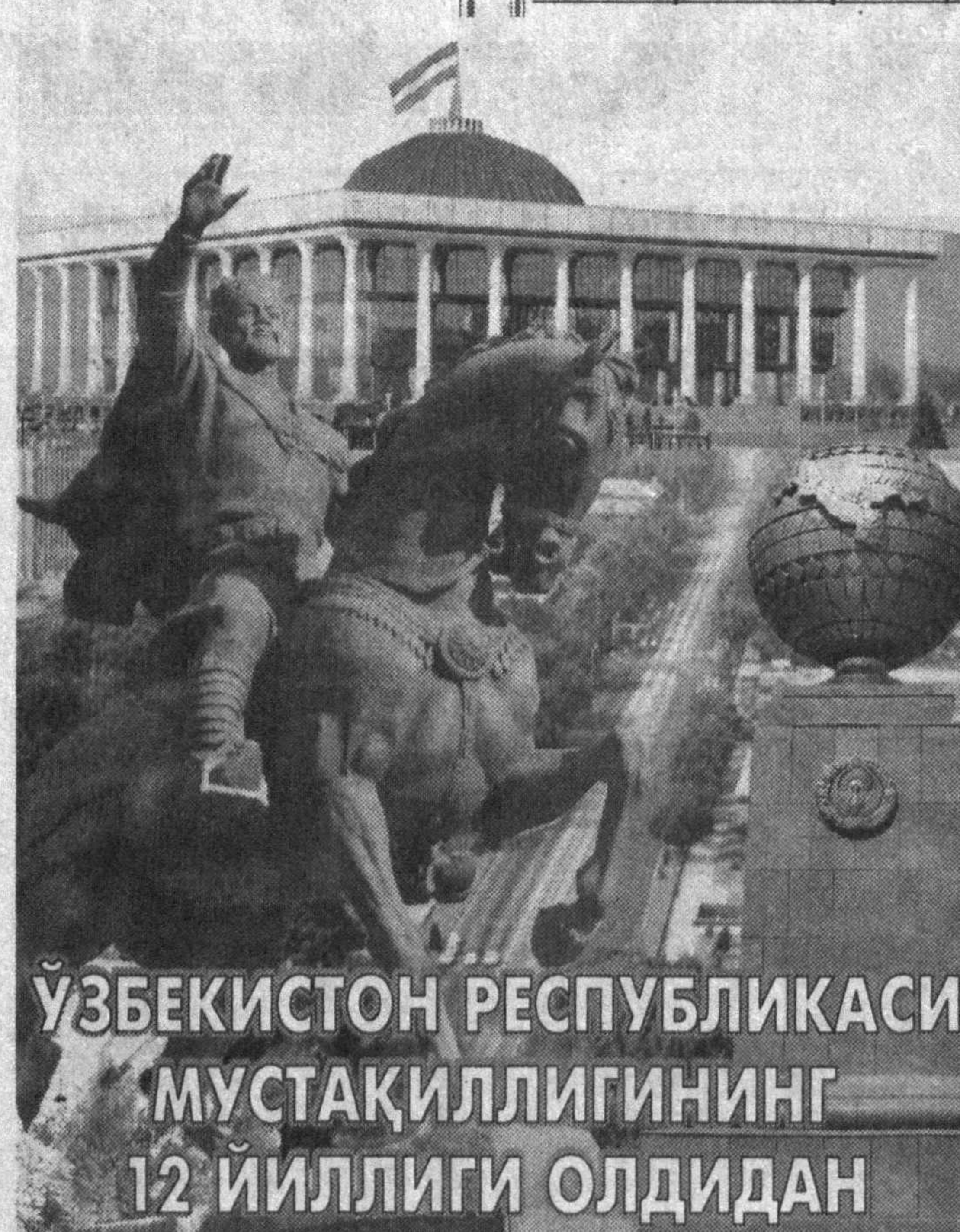
ЎЗБЕКИСТОН РЕСПУБЛИКАСИ МУСТАҚИЛЛИГИНИНГ 12 ЙИЛЛИГИ ОЛДИДАН