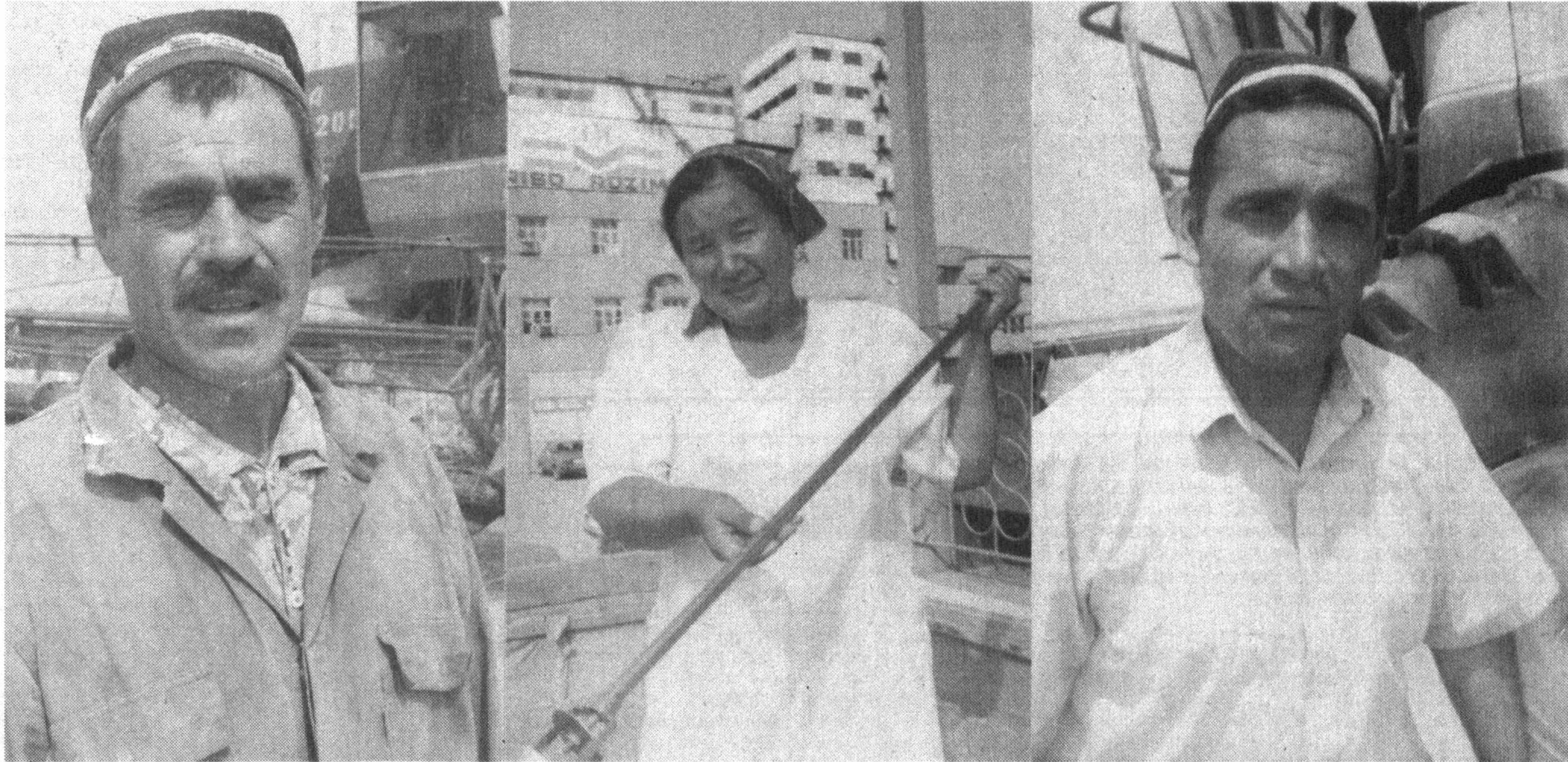
Гузур тумани ғаллакорлари бу йил 25 минг гектар майдонда мўл ҳосил етиштирдилар. Мавсум қатнашчилари учун барча шарт-шароитлар яратилганлиги ўз самарасини берди. Туманда етишти-