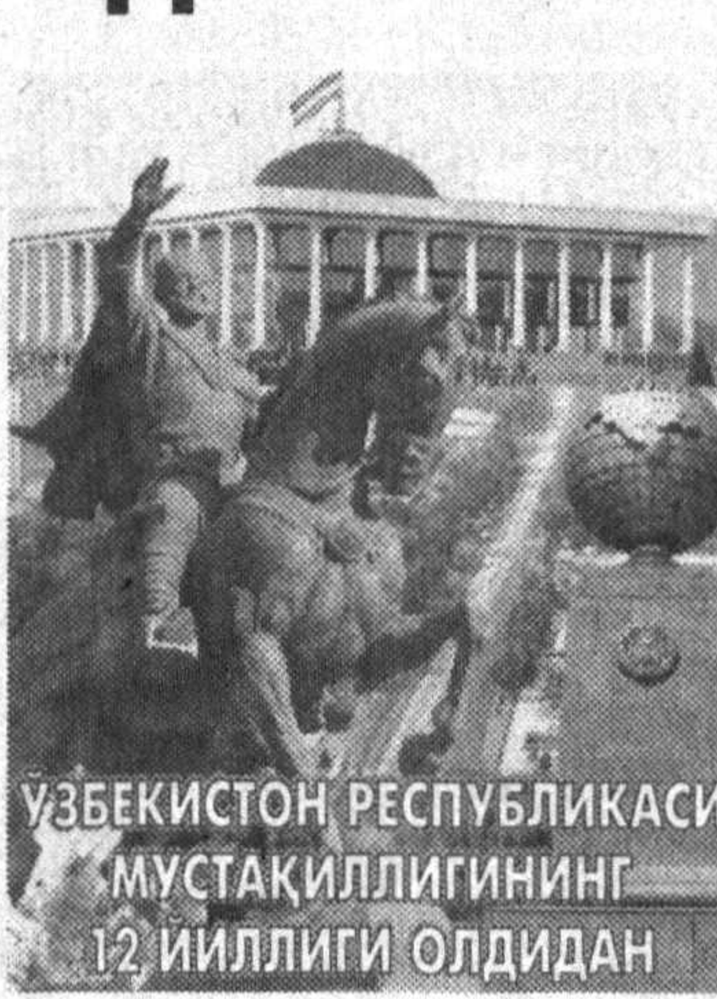
ЎЗБЕКИСТОН РЕСПУБЛИКАСИ МУСТАҚИЛЛИГИНИНГ 12 ЙИЛЛИГИ ОЛДИДАН

билангина кифояланиб қолишмади. Ишлаб чиқариши янада кенгайтириш учун харақатга киришилди. Қўшимча ишлаб чиқариш бинолари барпо этилди. Корхона янада серунум ва замонавий машиналар билан жиҳозлаб берилди. Нихоят, 2000 йил бошида янги ишлаб чиқариш биносига кўчиб ўтилди. Натихада ишлаб чиқариш сезиларли даражада кенгайди, махсулот сифати яхшиланди.