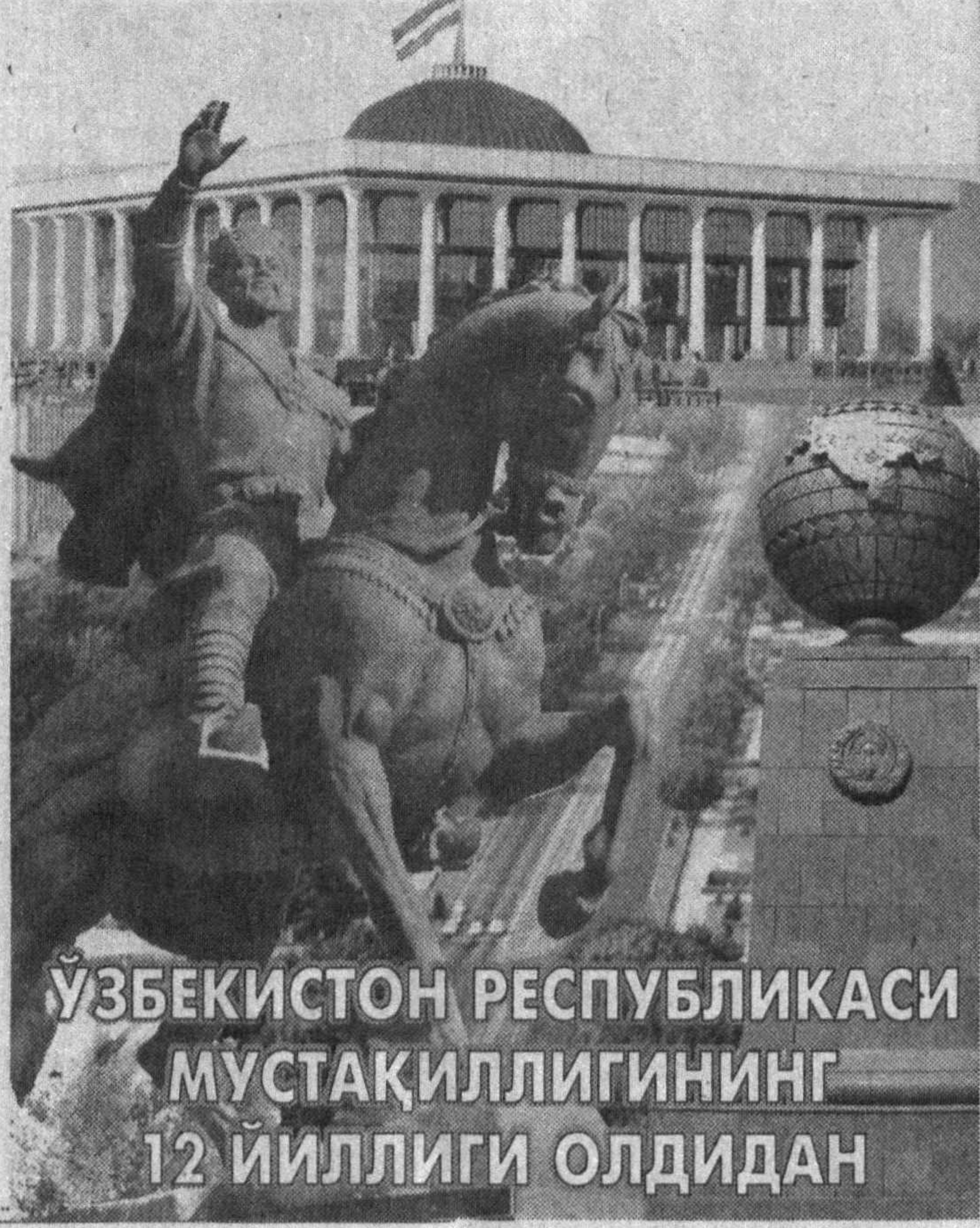
ЎЗБЕКИСТОН РЕСПУБЛИКАСИ МУСТАҚИЛЛИГИНИНГ 12 ЙИЛЛИГИ ОЛДИДАН