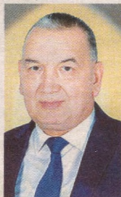
Мирза Азизов, Муқимий номидаги муסיқали драма театри директори, Ўзбекистон халқ артисти

Сизларни юртимизга залворли қадамлар, эзгуликлар билан кириб келган янги – 2020 йил билан муборакбод этаман. Халқимизга яхши кайфият улашиши, ҳаётларига файз бағишлаши, эзгу ниятларига ҳамкор-ҳамқадам бўлиши мақсадидаги заҳматли меҳнатингиз қалбларга қувонч, кўтаринкилик бахш этаверсин!