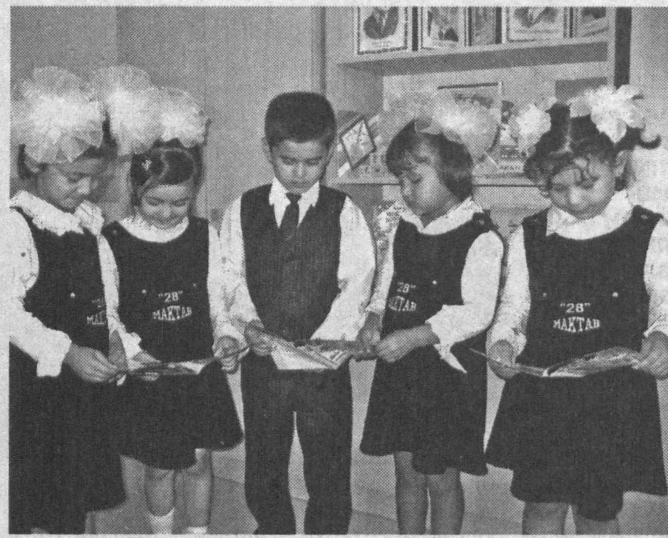
От урока к уроку растут познания детей. Отсюда и их победы на конкурсах и олимпиадах.