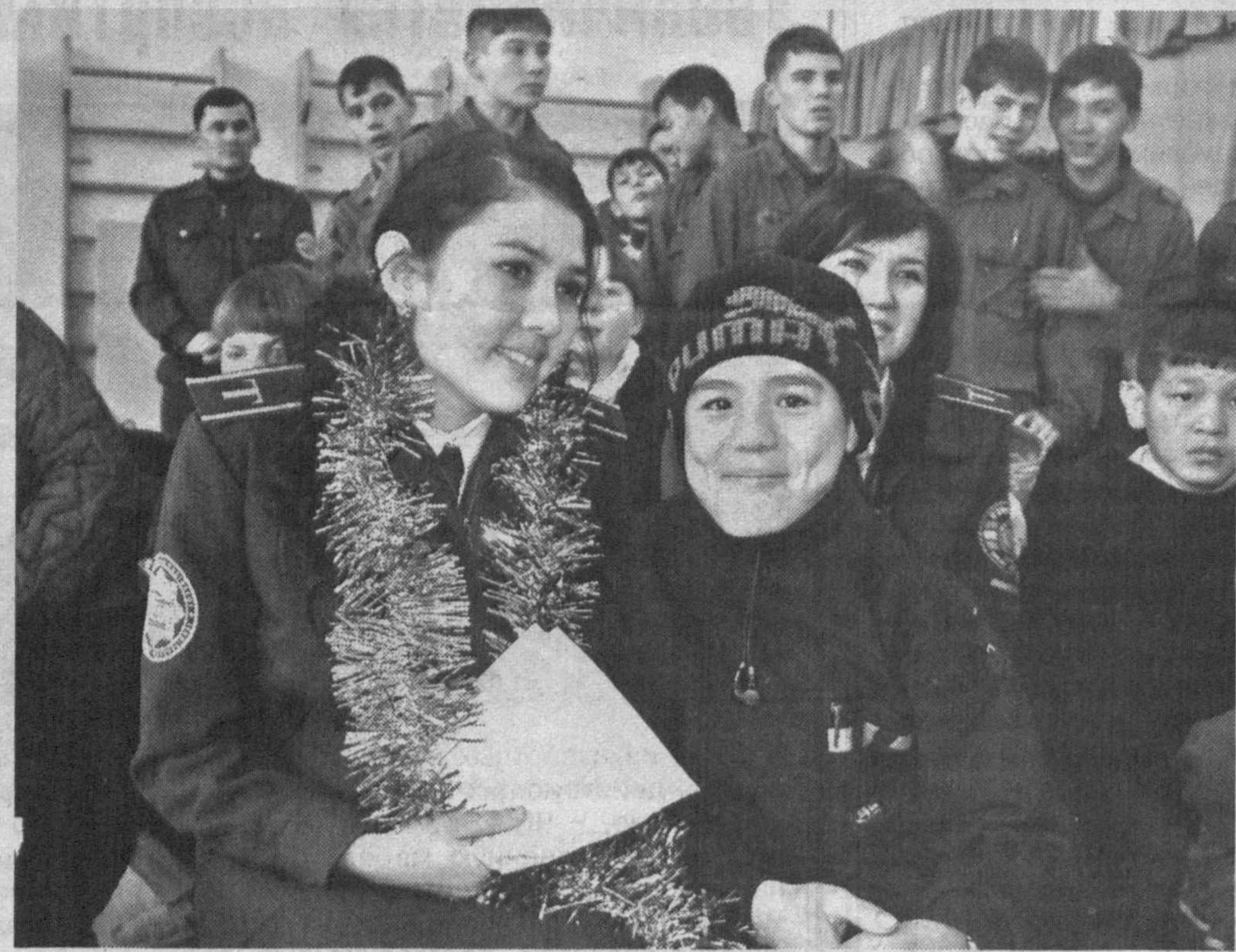
Радостным событием для воспитанников дома мехрибонлик стала встреча со слушателями одного из учебных заведений, готовящих кадры для МВД. Для ребят был устроен концерт, вручены подарки.